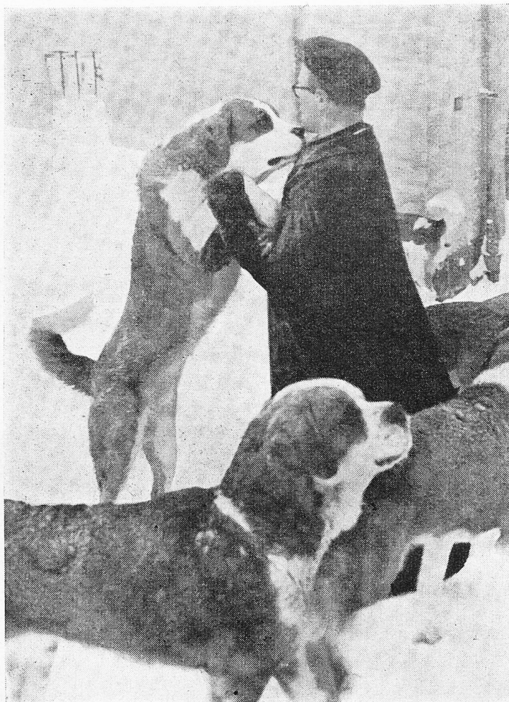
Mönch mit Bernhardinerhunden