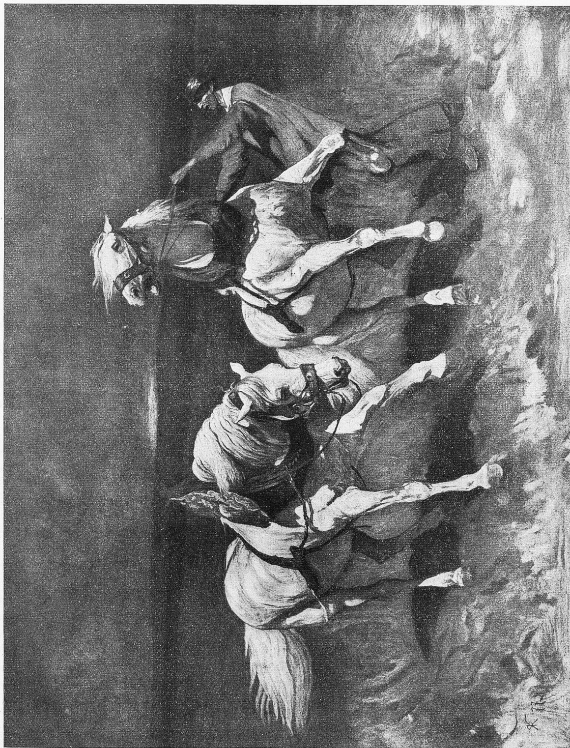
Schimmelgespann. Gemälde von Rud. Koller.