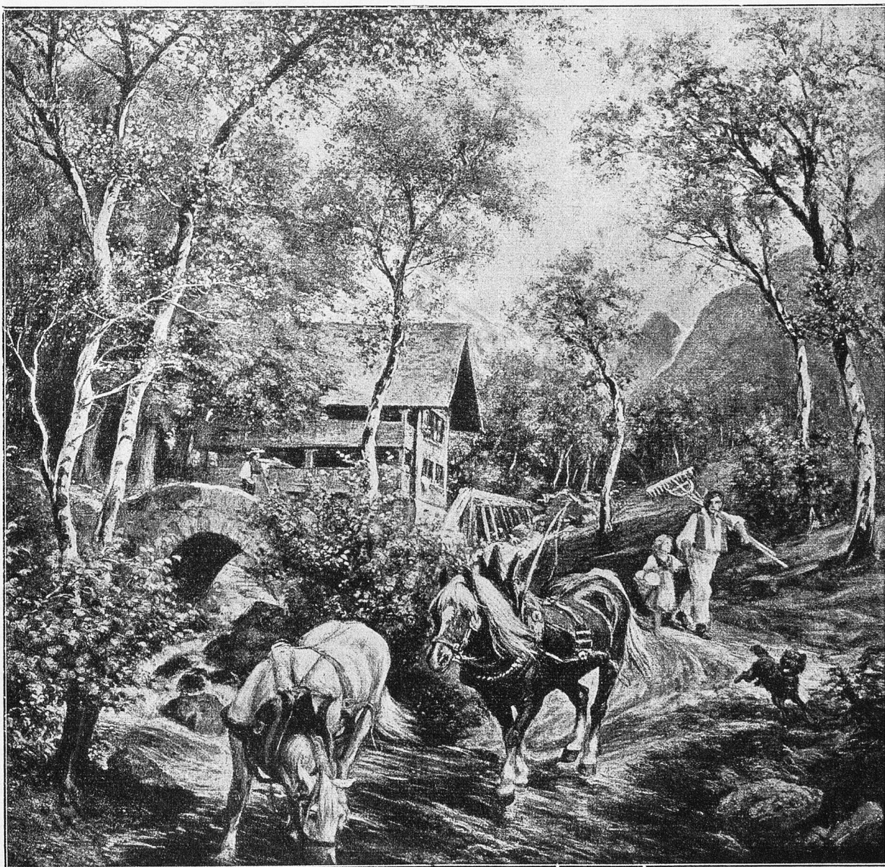
Pferde am Bach. Gemälde von R. Koller.

dann auch später die Mutter gewesen, die erkannte, dass sie dem Hang zu seiner Kunst entgegenkommen musste, während der Vater als nüchterner Metzger und Wirt mehr als einmal in den kritischen Zeiten künstlerischer Entwicklung seinem Buben unliebsame Hindernisse in den Weg legte. Die Geldmittel waren knapp, der junge Maler lernte in der Fremde hungern und dürsten, aber