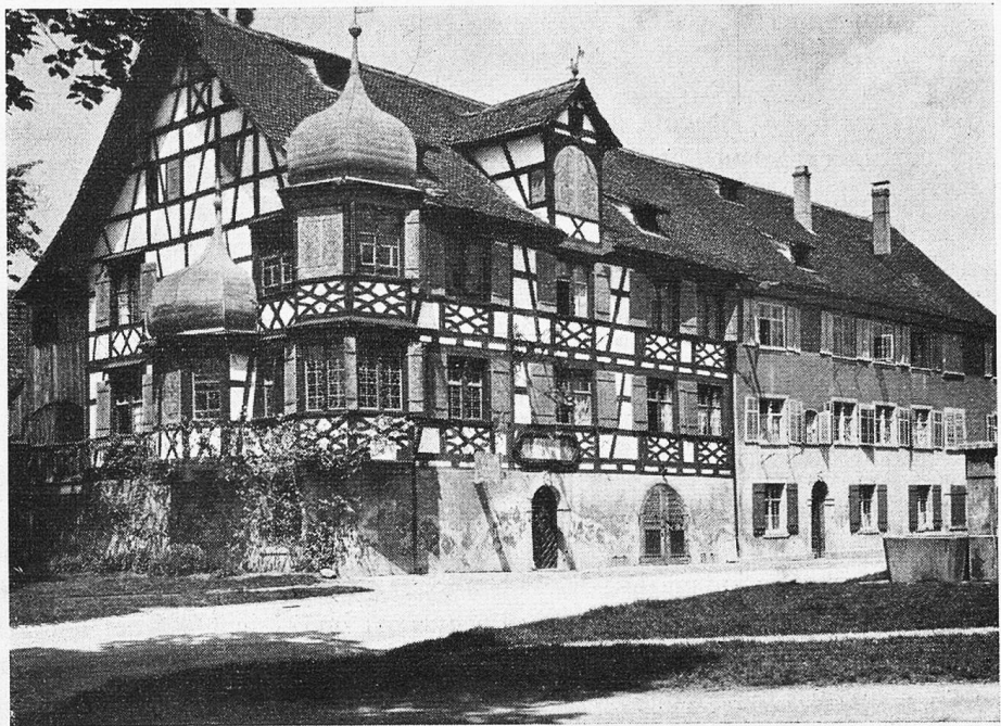
Die Drachenburg in Gottlieben, eines der schönsten Riegelhäuser in der Schweiz, erbaut 1617.

Auch wird erzählt, dass ein Bauer, welcher einst daselbst in Schlummer verfiel, sich plötzlich in die versunkene Burg hinunter entrückt sah. In einem grossen Gemache sassen der Ritter und seine Genossen auf glühenden, eisernen Stühlen um einen runden Tisch, welcher mit Speisen und Getränken mancherlei Art besetzt war. Vom quälendsten Hunger bis auf Haut und Knochen abgemagert, waren sie gezwungen, die siedendheissen Speisen und Getränke zu verschlingen und brüllend ob dem höllischen Spuke, der dadurch in ihren Gedärmen verursacht wurde, wälzten sie sich dann auf dem Boden herum, als gerechte Strafe für die einst in frevler Lust verübten Missetaten. Die Uhr aber wies noch immer die erste Stunde des Festtages. Nebenan in einem schön geschmückten Saale sassen an einer vollbesetzten Tafel diejenigen Armen, welche einst von dem gefühllosen Ritter und seinen Gesellen mit Spott und Hohn vom Schloss getrieben worden waren, und in das Schmerzgestöhne der Nachbarn mischten sich ihre Freudenstimmen.