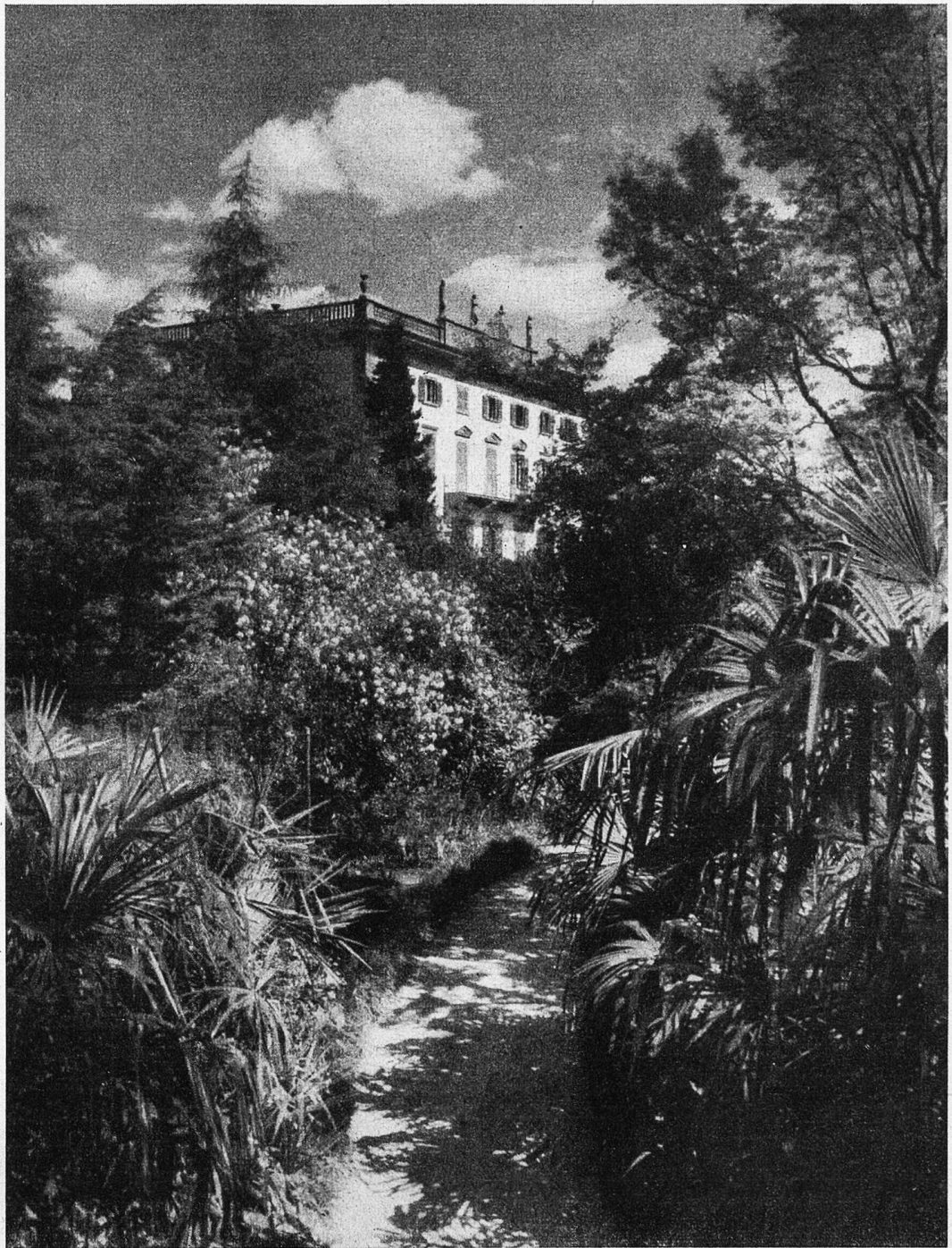
Der Palast inmitten einer tropischen Welt mutet wie ein Bild aus fernen Ländern an.

lichen Erwerbung der Inseln zu gewinnen. Mit 100 000 Fr. aus dem Ertrag der Taleraktion des Natur- und des Heimatschutzes wurde die Basis geschaffen, auf der sich der Staat mit 200 000 Fr., die Gemeinden Ascona und Brissago mit je 125 000 Fr. und Ronco mit 50 000 Fr. beteiligten. Ausserdem sicherte für die Zurichtung und den Unterhalt des Parkes der Heimatschutz für die nächsten Jahre angemessene Beiträge zu und stellte Baron v. d. Heide als Freund des letzten Inselbesitzers eine ansehnliche Summe in Aussicht.