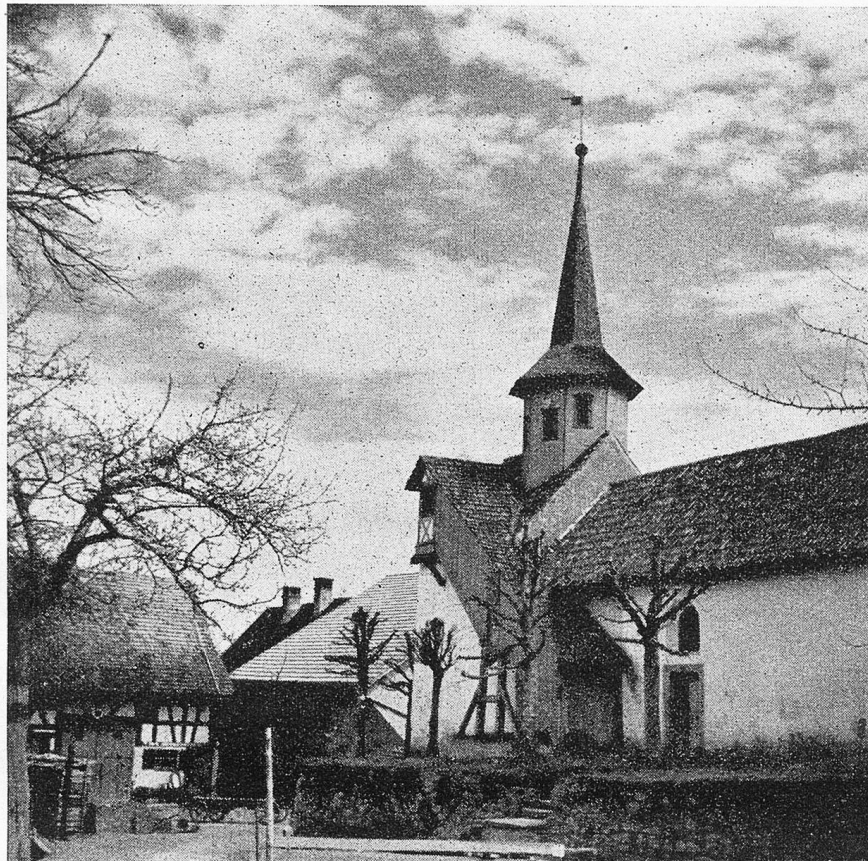
St. Antoniuskapelle in Waltalingen

Wir aber wissen sicher, dass unsere Leserinnen