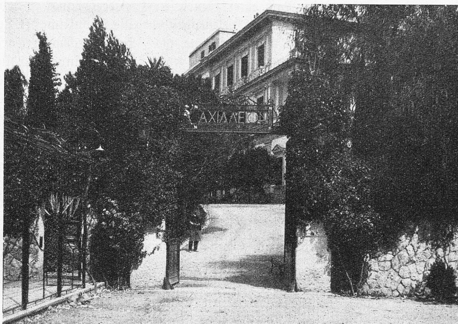
Das Achilleion wird Hotel. Haupteingang zum Achilleion

auch in andern Beziehungen, ihrer Zeit um Jahrzehnte voraus. Sie war eine ausgezeichnete Reiterin, die auch die wildesten Pferde zu meistern vermochte, liebte zu baden und zu schwimmen, lernte noch in vorgerückten Jahren fechten. Daneben war sie zeitlebens eine erstklassige Läuferin und machte oft wahre Gewaltmärsche, bei denen ihre Begleitung nur mühsam zu folgen vermochte. Obwohl sie nicht besonders eitel war und billige Popularitätshascherei stets vermied, war sie ihrer blendenden Schönheit bewußt und unterließ nichts, was ihre königliche Haltung, ihre körperliche Geschmeidigkeit und ihre Schlankheit zu erhalten versprach. Aus Angst, ihre elegante Linie zu verlieren, lebte sie äußerst einfach, oft beinahe spartanisch, so daß die Ärzte für ihre Gesundheit fürchteten. Noch als Urgroßmutter turnte und trainierte sie stark und war unerhört gelenkig.