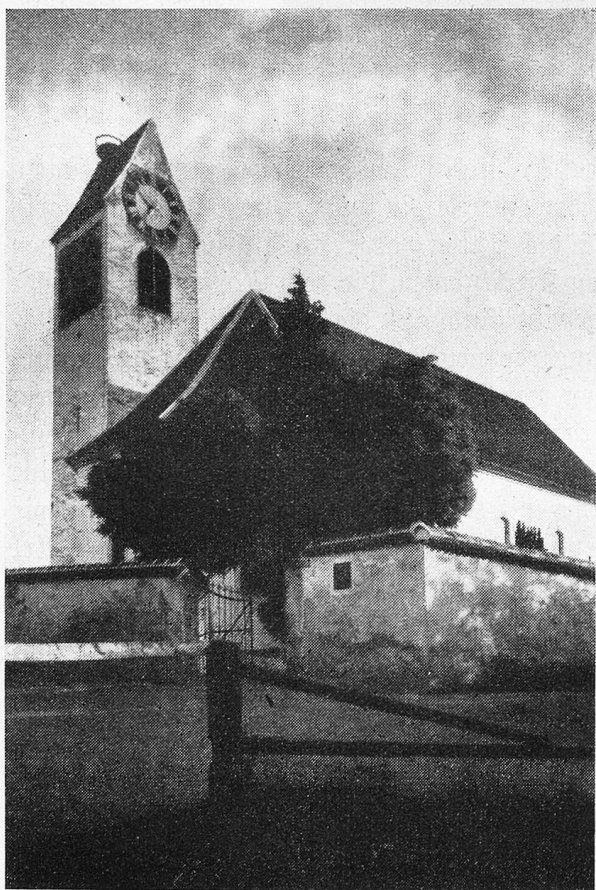
Die alte malerische Kirche, mit massigem Käsbissenturm und dem Storchennest auf dem Dache fügt sich mit ihrer schlichten Schönheit harmonisch dem lieblichen Dorfbilde ein.

Schon in altersgrauer Zeit war es, als die wilden Horden der Alemannen aus den finstern Wäldern des Nordens auf ihren Kriegstürmen im Jahr 406 in Helvetien einbrachen und sich in der Nord- und Ostschweiz für immer festsetzten. Eine ihrer Sippen, die natürlich noch keine großen Architekten waren, baute auf dem Boden des heutigen Dorfes Stadel ihre primitiven Holzhäuser mit beinahe auf den Boden reichenden Strohdächern. Wenn die alemannischen Baukünstler von 406 die schönen Stadlerhäuser unserer Zeit sehen könnten, würden sie aus dem Staunen nicht herauskommen. Hier vorkommende Orts- und Flurnamen, wie auch die vielerorts gemachten Funde, weisen auf eine Besiedlung dieser Gegend durch dieses Volk hin.