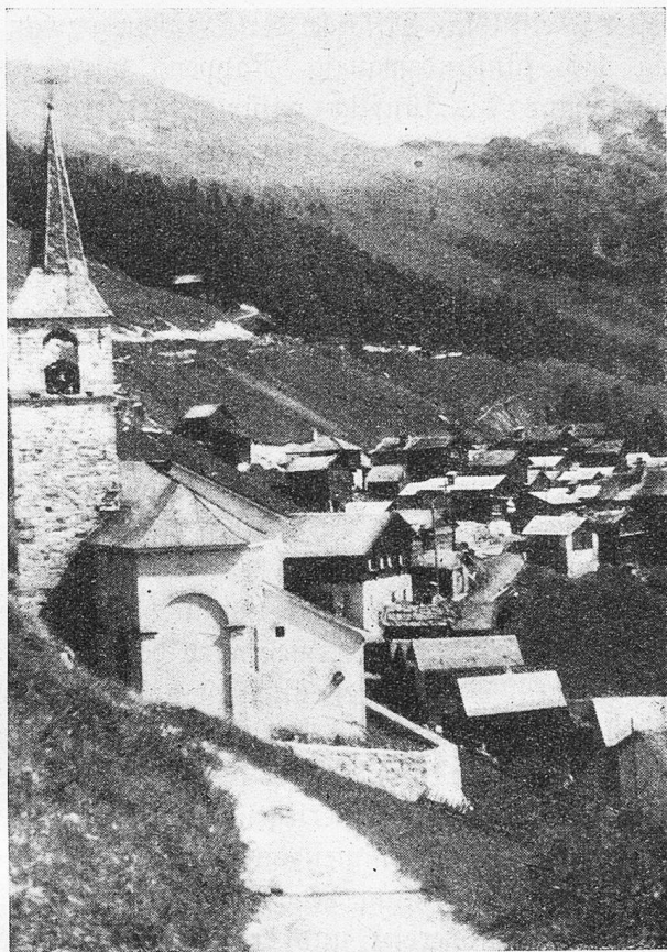
Chandolin etwas über St. Luc im Val d'Anniviers Kirche und Dorf Chandolin, hoch auf 2000 m gelegen

Immer neues Land rollt herbei. Rüche, Rüche, Rüche. In der Schule lernten wir einmal, daß man mit Rüchen rechnen könne, daß Volksstämme den Reichtum, das Erbe, die Mitgift, den Preis für eine Frau nach der Anzahl der Rüche berechnen. Plötzlich fühle ich mich erbärm-