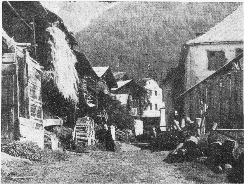
Dorfidyll von St. Luc Vollgepfropft sind die Hütten der eingebrachten Ernte

... Dann kommt der Wimmel, la vendage. Deswegen bin ich doch eigentlich ins Weinland gefahren. Ich stelle mir so etwas wie ein Trau-