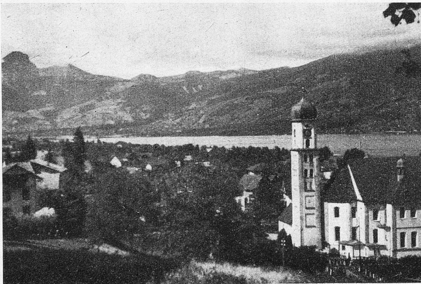
Sachselsn mit Sarnersee

Das sonnige Tälchen will kein Ende nehmen. Immer noch strahlen die weißen Backen in unerreichter Ferne, immer wie-