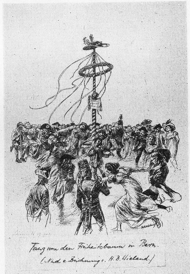
Tanz um den Freiheitsbaum in Bern. (Nach einer Zeichnung von H. B. Wieland.)

den gehalten; Kinderchöre funktionierten, und abends war Tanz und Bankett. Der Baum war oft nur Vorwand, ein Fest zu feiern. Nach einigen Jahren änderte sich der Sinn der Zeremonie etwas, der Baum wurde nun vor allem ein Protest gegen die Feinde der Revolution, die sich in der Wirklichkeit oder in der Einbildung erhoben. Die Verbreitung des Baumes vergrößerte sich dadurch nur. Sogar die Kolonien ahmten es nach. Am 9. August 1794 erschien vor dem Convent eine Delegation aus Senegal, die berichtete, daß in St. Louis auf dem Platz des frühern Sklavenmarktes ein Freiheitsbaum