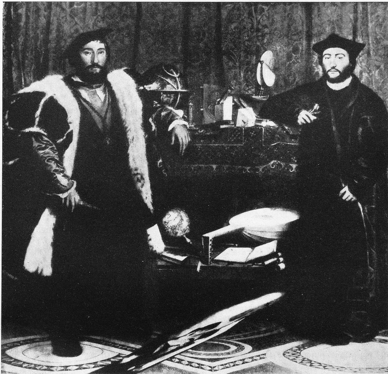
Hans Holbein d. J.: Zwei Botschafter.