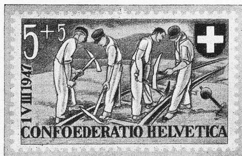
Eine der 1.-August-Marken, die an die Jahrhundertfeier der schweizerischen Eisenbahnen erinnern: Gramper an der Arbeit am Bahngeleise.

Ohne Vorbereitung aber kommen keine guten Leistungen zustande. Darum ist gründliche berufliche Förderung unserer Jugend so wichtig. Dies gilt für gesunde, nicht minder aber für gebrechliche Jugendliche. Auch sie können an geeignetem Platz und nach sorgfältiger Vorbereitung ganze Arbeit leisten. Vielleicht erfordert ihre Ausbildung etwas mehr Zeit als üblich oder macht die Anschaffung gewisser Hilfsmittel notwendig. Wer aber wollte bestreiten, daß solche Mehraufwendungen sich lohnen, wenn der Behinderte dadurch zur Selbständigkeit gelangt?