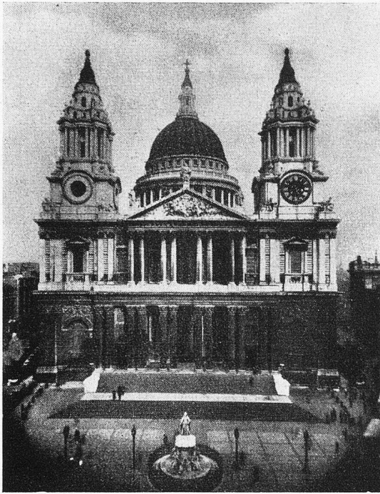
St. Paulskirche London, die größte Protestantische Kirche der Welt

der königliche Nachtaufzug zwischen den beiden Königspalästen. Die königliche Garde ist gut kenntlich an ihren roten Uniformen und den hohen Bärenfellmützen. — Wer in London Abwechslung sucht, kommt sozusagen — wenigstens vor dem Kriege — Tag und Nacht auf seine Rechnung. Denn Theater aller Gattungen und Grade, Opernhäuser, Konzertsäle, locken zum Besuche. Auffällig berühren den fremden Besucher die zahlreichen Straßenprediger aller Konfessionen und Sekten, die durch lautes Gebahren und Musik die Zuhörer um sich zu scharen suchen. Ein hervorragender Zug des englischen Volkes ist seine Freiheitsliebe und die Gastfreundschaft. Nach verschiedenen Kreuz- und Quersfahrten in der englischen Landschaft mit ihren uralten Kirchen und Schlössern nahm mich der raffige Riesenvogel der „Swissair“ wieder unter seine Fittiche, und mit großartigen Eindrücken jeglicher Art bereichert, landete ich wohlbehalten auf dem Basler Flugplatz.