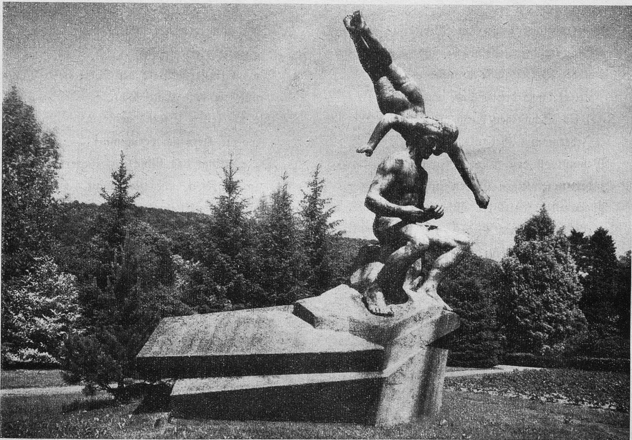
CARL SPITTELER-DENKMAL IN LIESTAL

Von 1900—1906 entstand der „Olympische Frühling“, wohl die bedeutendste Schöpfung des deutschen Neuklassizismus. Sie brachte ihm den sehnlich erwarteten Ruhm ein: den Ehrendoktor der Zürcher Hochschule, den Schweizer Schillerpreis, den Bauernfeldpreis und 1919 sogar, als dem einzigen unter den Schweizerdichtern, den Nobelpreis und damit literarische Weltgeltung. — Doch Widerwärtigkeiten bleiben keinem Irdischen erspart, und mag er noch so hoch stehen. Als sich 1914 ein Graben auftun wollte zwischen den deutsch- und den französischsprachigen Eidgenossen, da wandte sich Spitteler mit seiner Zürcher Rede „Unser Schweizerstandpunkt“ an die hadernden Brüder und forderte sie zur Sammlung im Zeichen des weißen Kreuzes auf. Damit bewies er, daß er trotz internationalem Denken und ungeachtet seiner „Weltmannsallü-