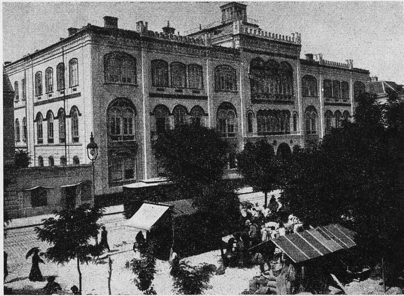
Belgrad. Alte Universität

an Gebäck und Süßigkeiten werden ausgerufen, und auch ein Alter mit einem Gefäß voller pikant zubereiteter Rutteln findet unter den auf Verdienst lauernden Lastträgern seine Abnehmer. Durch die Errichtung großer Markthallen hat dies bunte Getriebe viel von seiner Originalität eingebüßt; in hygienischer Beziehung wurde dafür, besonders in der sehr heißen Sommerzeit, manche Besserung erzielt.