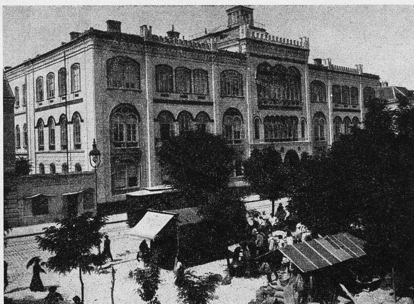
Belgrad. Alte Universität

an Gebäck und Süßigkeiten werden ausgerufen, und auch ein Alter mit einem Gefäß voller pikant zubereiteter Rutteln findet unter den auf Verdienst lauernden Lastträgern seine Abnehmer. Durch die Errichtung großer Markthallen hat dies bunte Getriebe viel von seiner Originalität eingebüßt; in hygienischer Beziehung wurde dafür, besonders in der sehr heißen Sommerzeit, manche Besserung erzielt.