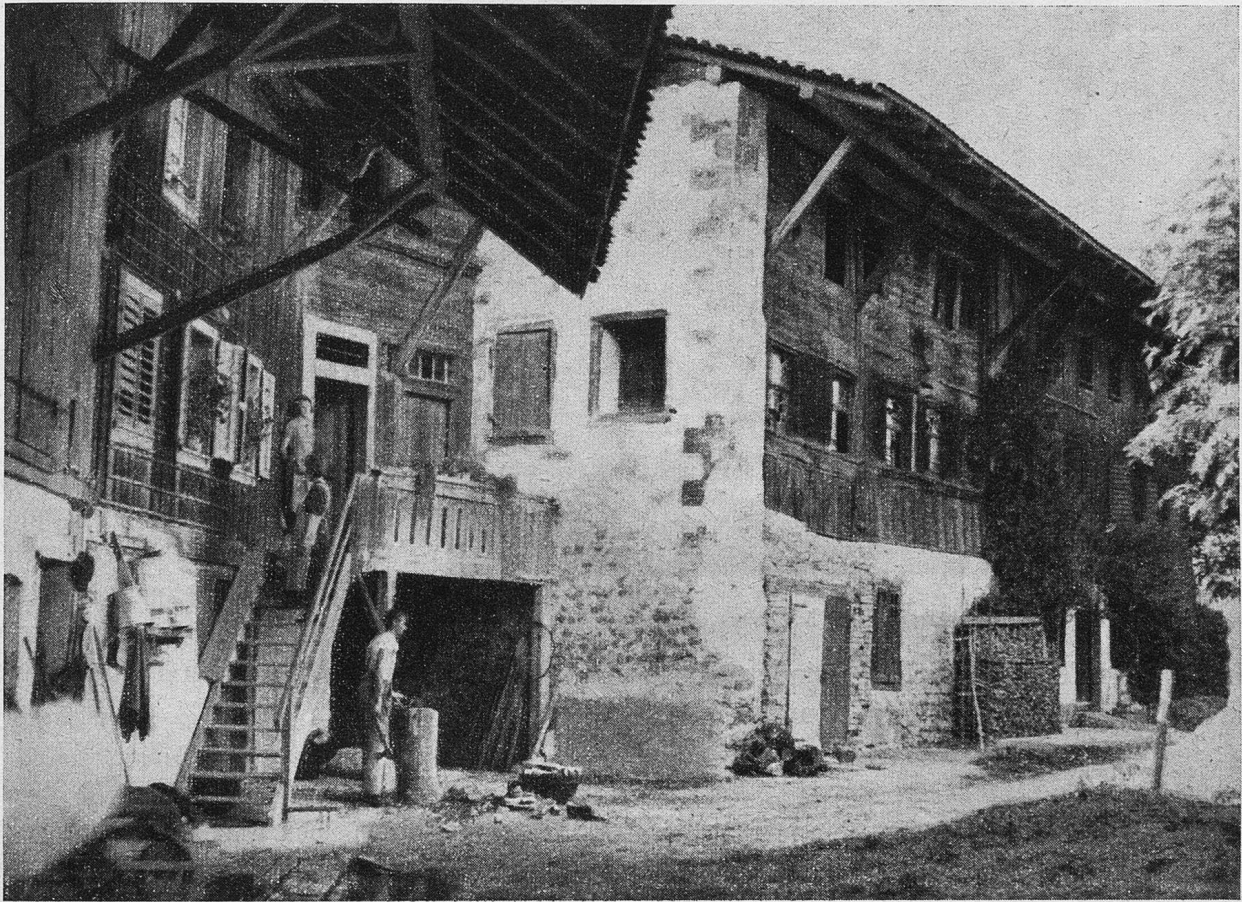
Das uralte Rathaus