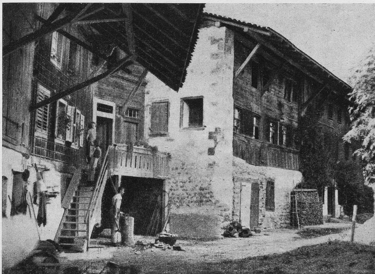
Das uralte Rathaus