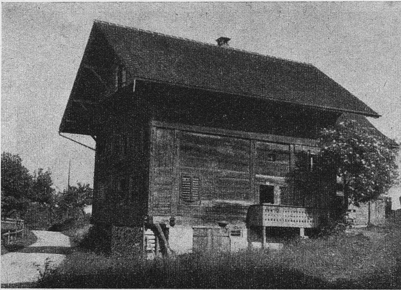
Ein aus der Zeit vor 1291 stammendes Meienbergerhaus

gelagert gewesene Steinplatte eine ziemlich starke Vertiefung ausgetreten worden. Das