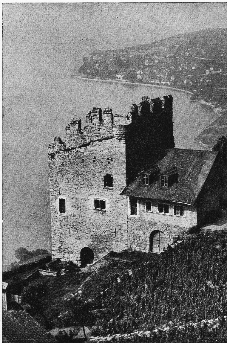
La Tour de Marsens

Schon in den ältesten Siedelungszeiten unseres Landes führten wichtige Verkehrswege vom Genfersee nordwärts nach dem Rhein. Ihnen folgte Freund und Feind. Wer sich im Lande niederließ, war gezwungen, sich gegen die Gefahr zu schützen. Sie bauten auf felsigen Vorsprüngen oder Anhöhen Zufluchtsstätten und verrammten sie mit hölzernen Schanzen. Als dann aber die Germanen und gar die Hunnen durch unsere Gauen plünderten, hielten die Holzverhaue dem Ansturm nicht mehr stand. Steinbauten traten an ihre Stelle, die im 11. Jahrhundert zu Burgen ausgebaut wurden.