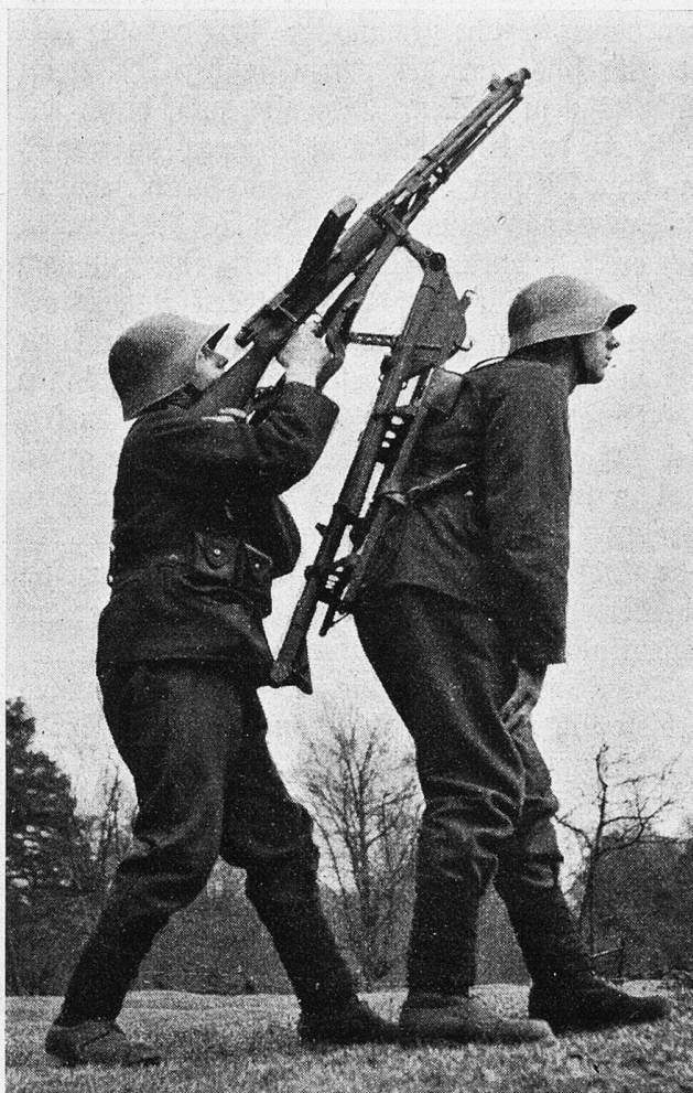
Leichtes Maschinengewehr auf Fliegerlafette montiert.

Wie herrlich mußte es sein, der armen Menschheit solche Dienste zu leisten! Nur zu bald sollte Dunant seine Aufgabe bekommen. Am politischen Himmel gewitterte es. Und bald schlug der erste Blitz ein. Henri Dunant zog nach Italien. In Solferino fand er reichlich Gelegenheit, mit seinen hilfreichen Händen zuzugreifen. Er sah Dinge, die neue Pläne in ihm reifen ließen. Was er hier auf dem blutigen Schlachtfeld sah und erlebte,