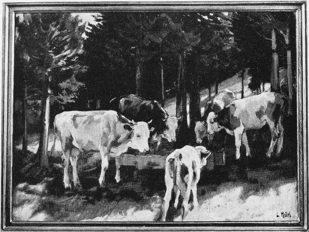
Tränke im Jurawald.

Nach einem Gemälde von Ernst Hodel, Luzern.