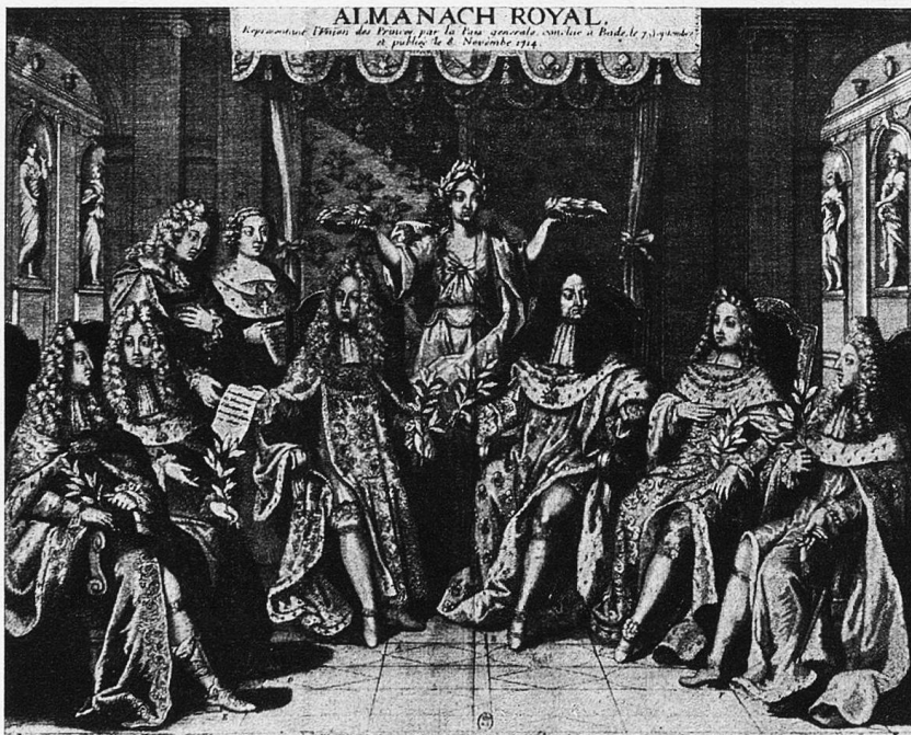
Symbolische Darstellung des Badener Friedens zwischen den regierenden Fürsten Europas.