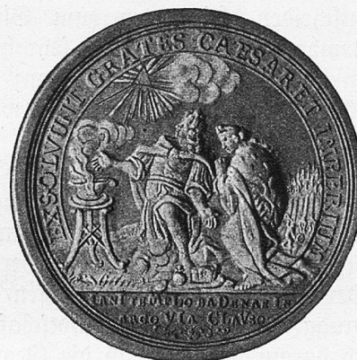
Wiener Friedensmedaille 1714.

kaiserlichen Gesandten in den Schatten zu stellen. Die gnädigen Herren von Bern erwiesen sich dem Gesandten Frankreichs gegenüber besonders höflich, indem sie ihm das „Bernerhaus“ an der Weiten Gasse als Wohnstätte anboten, damit er nicht in einem Gasthaus zu logieren brauchte. Die Tagsatzungsgesandten Berns hatten nämlich regelmäßig in einem stattlichen Gebäude gewohnt, das seit 1678 immer für sie bereitstand und auch heute noch eines der schönsten Wohnhäuser der Badener Altstadt bildet. In diesem behaglichen Wohnhaus wurden Wände entfernt und Ofen abgebrochen, um weiträumige Säle zu gewinnen, die mit allem Glanz der höfischen Raumkunst Frankreichs eingerichtet wurden. Am 30. Mai erschien Graf du Luc mit gewaltigem Gefolge in der Bäderstadt. Er ließ seine Dienerschaft neu uniformieren, brachte sein ganzes Silbergeschirr mit und ließ auch seine französischen Komödianten, Musiker und Tanzkünstler in Baden auftreten. Sein Gefolge umfaßte insgesamt 300 Personen. Dem zweiten französischen Bevollmächtigten hatte Graf du Luc das Städtchen Baden als