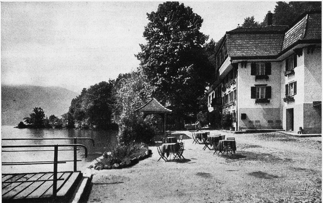
Ruhhaus Baumgarten bei Immensee.

geöffnet war, blühte es mit einem Mal. Die Birn- und Apfelbäume hatten es so eilig, daß sie nicht hinter den Kirschbäumen zurückstehen wollten. So ging es an ein Wettfeiern und Wettblühen landauf und -ab, und der Freund so bezaubernder