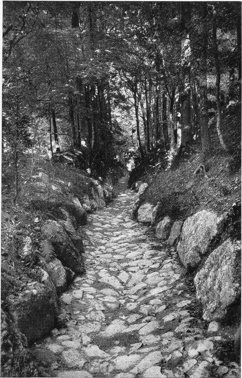
„Hohle Gasse“ bei Rüschnacht a. Rigi.

Ich wandte mich wieder dem Ufer des Sees zu