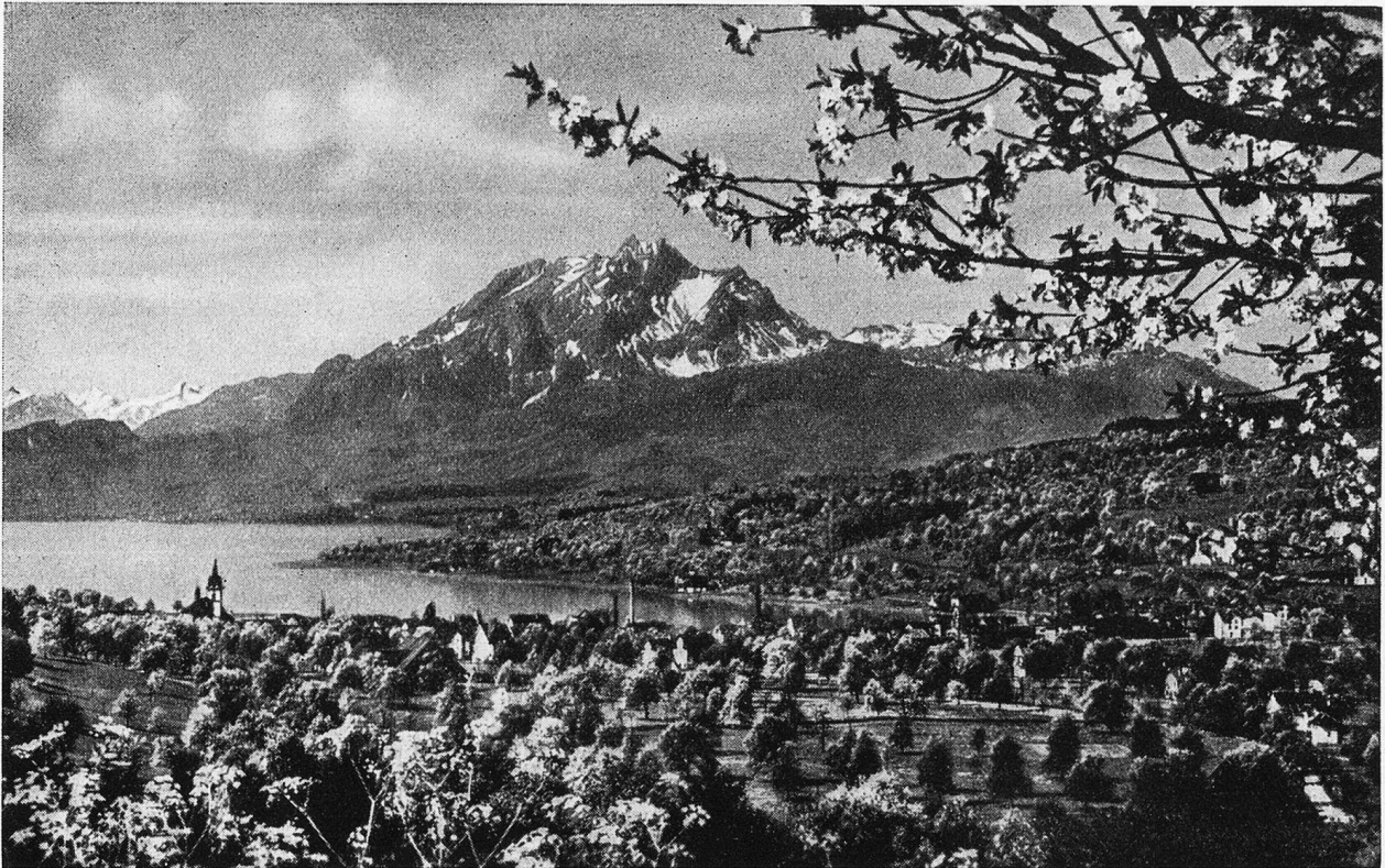
Rüfnacht a. Rigi mit Pilatus.

Beglein dem Riemen nach nicht. Ich seh' ihm an, daß es mich beglücken wird.