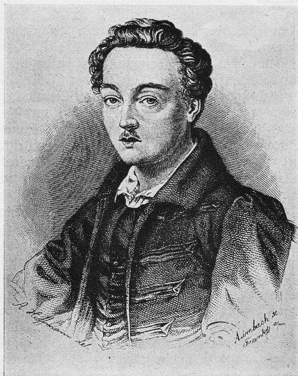
Georg Büchner (1813—1837).

dahin hatte sich Büchner poetisch nicht schöpferisch betätigt, und auch den politischen Geschehnissen seines Vaterlandes gegenüber, das sich wohl von der napoleonischen Fremdherrschaft befreit, aber unter den durch Metternich angeregten „Karlsbader Beschlüssen“, die sich insbesondere gegen die Lehrfreiheit der Universitäten, die Pressefreiheit, gegen die Burschenschaften und die Turnvereine wandten, tief zu leiden hatte, war er ruhig geblieben. Den sogenannten Frankfurter Wachensturm von 1833 verurteilte er damals als ein vergebliches und voreiliges Unternehmen. Als er aber den Gesetzen seines Landes Folge leistend nach Gießen zurückkehrte, um dort seine Studien weiter fortzusetzen, wurde auch er von der revolutionären Welle mitgerissen. Dazu mochte wohl die Bekanntschaft mit dem im nahen