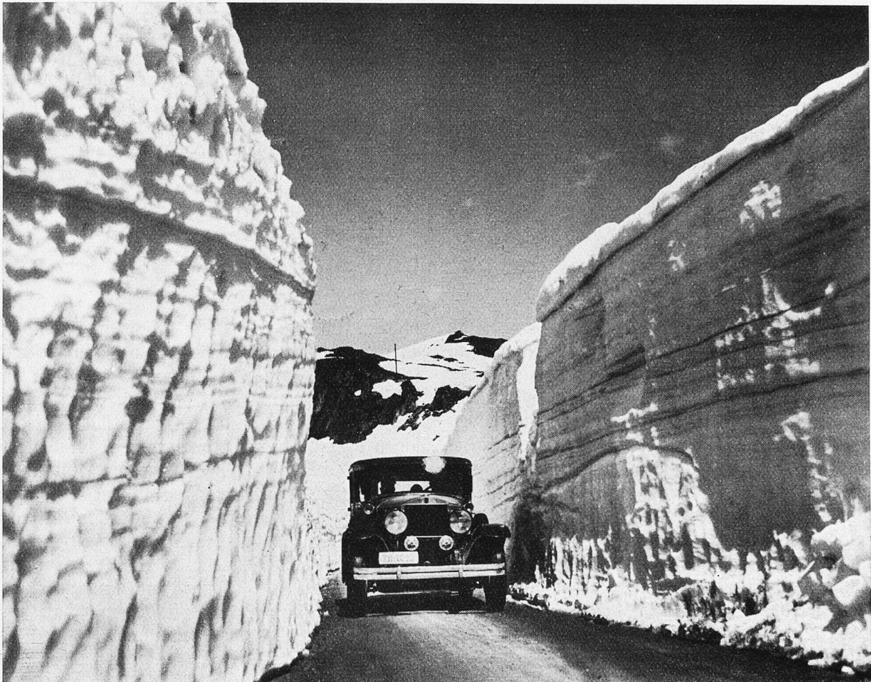
Gotthardpaß gegen die Tremola.