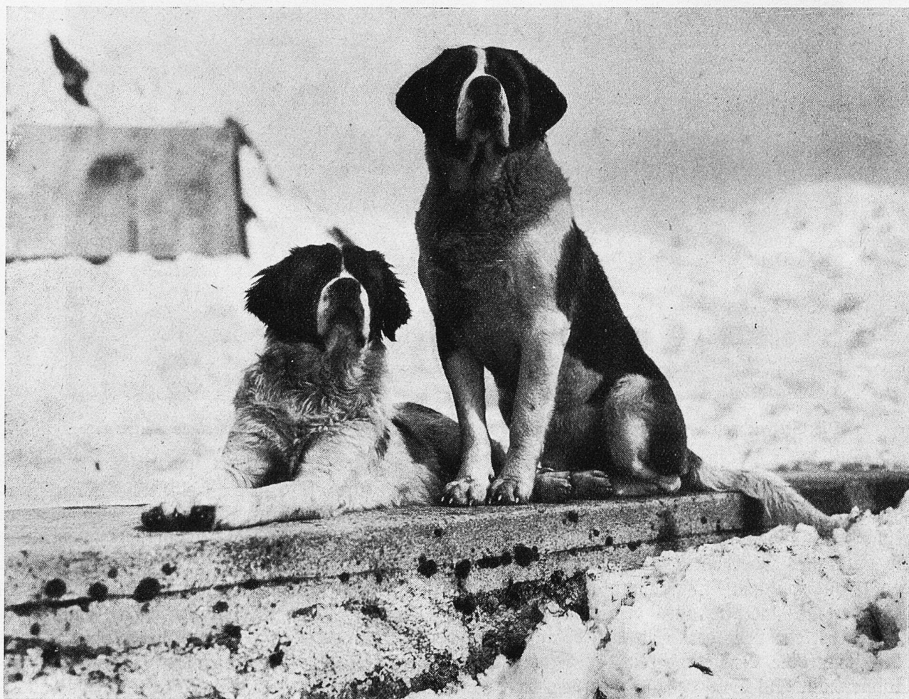
Die treuen Wächter auf dem Gotthard-Hospiz.

Der Gotthardpaß kam nach der Erbauung der stiebenden Brücke immer mehr in Aufschwung, und gegen Ende des 13. Jahrhunderts wurde der