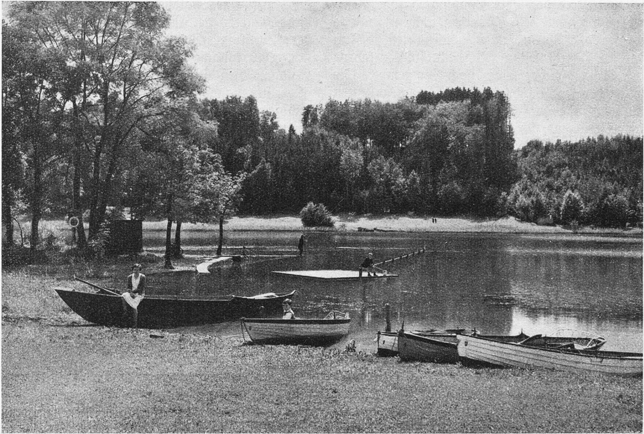
Idyll am Zürlersee.