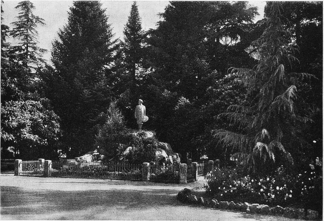
Arco (Trentino). Öffentlicher Garten mit dem Segantini-Denkmal.