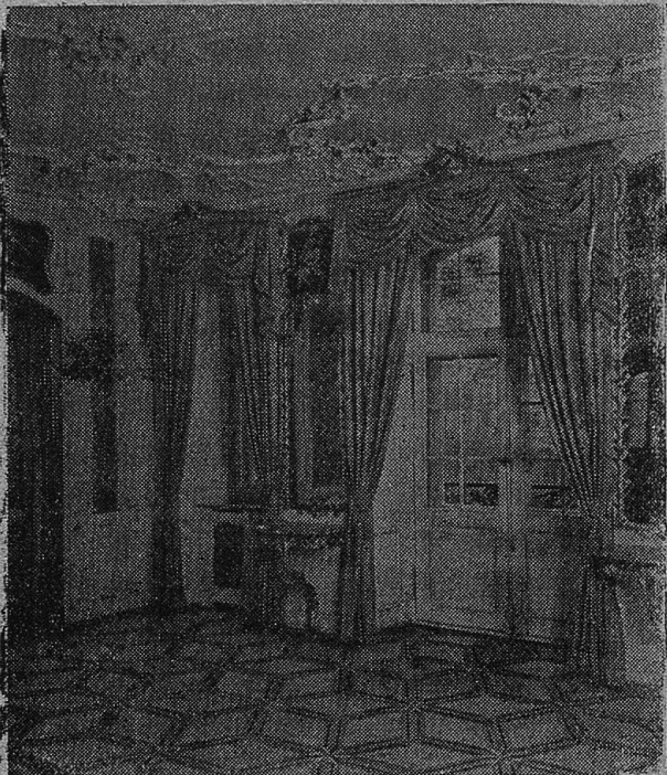
Gelber Salon Rechberg. Stilvorhänge, ausgeführt d. unser Atelle.

Sessel-Flechterei Rohrmöbel, Korb- und Bürsten-Fabrikation