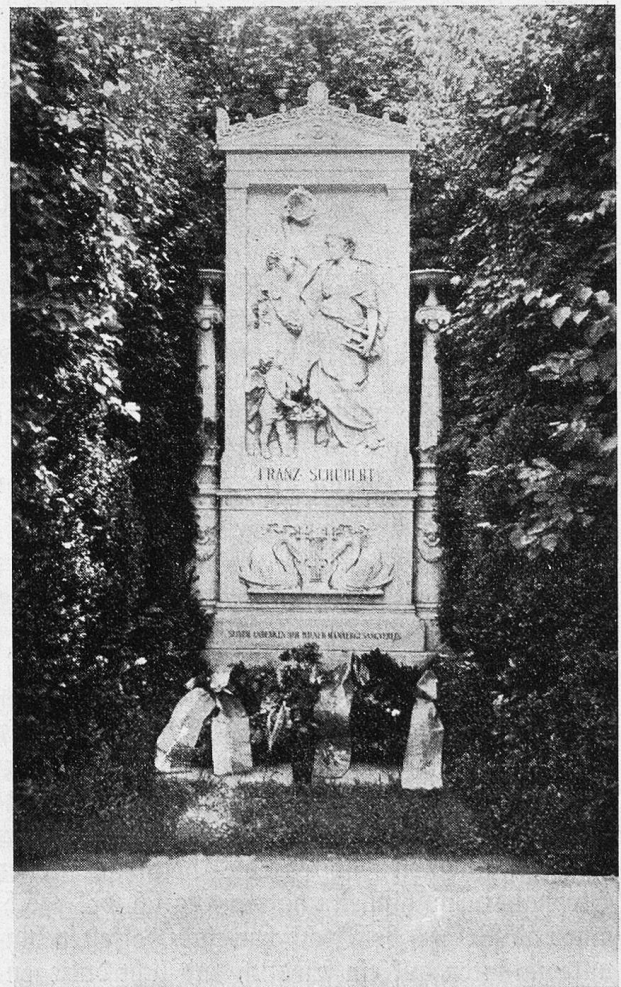
Zentralfriedhof. Franz Schuberts Grab.

Aber es steht doch in meinem Führer, sage ich. Ich habe den dicken Führer zwar nicht mitgenommen und die Straße vergessen. Ich hatte es mir so leicht vorgestellt. Man geht hinter dem Haydn-