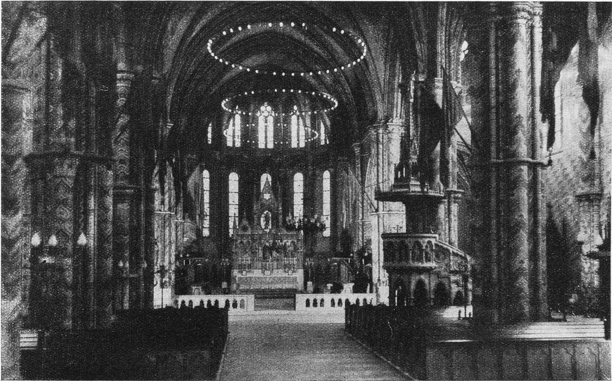
Budapest. Interieur der Krönungskirche.

die kundigsten Weltenbummler immer gesagt haben: Budapest reißt unter die schönsten Städte unserer Erde ein, und der mächtige Strom der Donau trägt viel zu ihrem Ruhme bei. Man ist versucht, zu glauben, sie stehe hier still. Wie ein ruhender See legt sie sich zwischen Buda und Pest, und einmal rahmt sie eine Insel ein, die Margareteninsel, die wie ein Garten des Paradieses das Treiben der Millionenbevölkerung vergessen läßt, in blühende Rosenhaine lockt und in Bäder, die nicht nur der Lustbarkeit dienen. Die heißen, der Erde entsprudelnden Wasser helfen den Rheumaleidenden und bieten ihnen die prächtigsten Plätze dar, wo sie sich tummeln und der größten Wohltäterin, der Sonne, hingeben können.