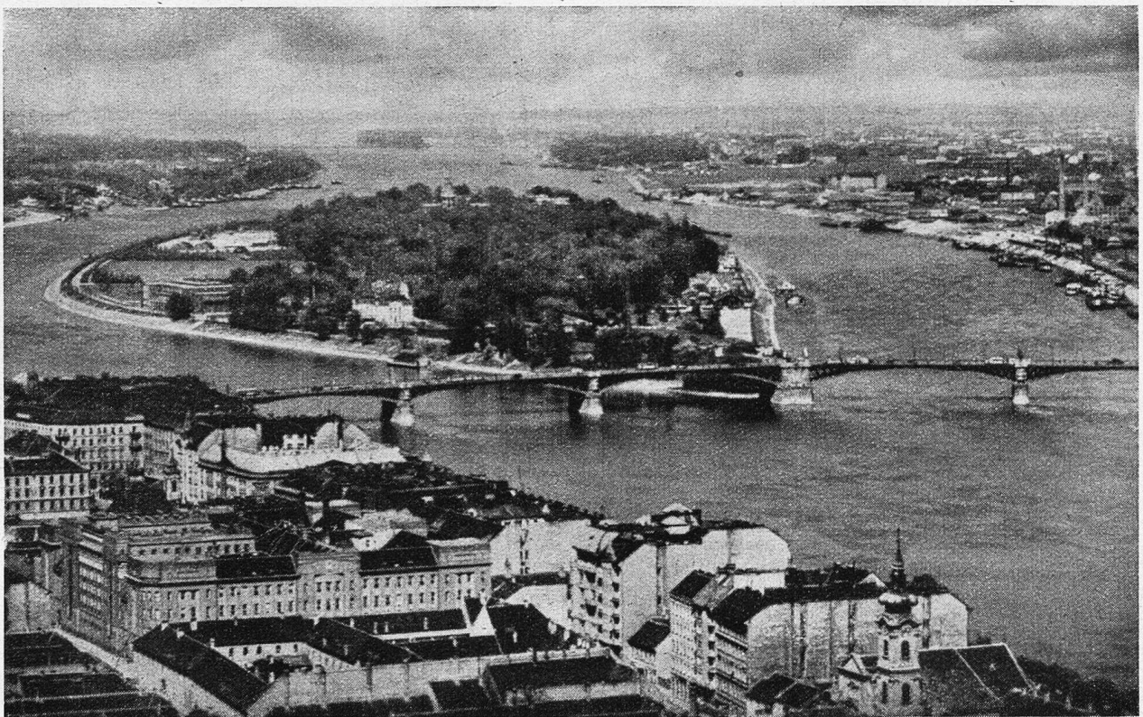
Budapest. Aussicht auf die Margareteninsel.

Budapest! Man sollte hier Zeit haben und verweilen können, Tage und Wochen. Es ist eine neue Welt, die man betritt, eine Welt von bedeutender Vergangenheit, von schweren Schicksalen, von einem Volkstum, das der Westeuropäer nicht ohne weiteres versteht. Man möchte eindringen, studieren und sieht sich vor eine ungeheuerliche Aufgabe gesetzt. Wir mußten uns gewissermaßen mit einem Fluge über alles das Schöne und Große, das Budapest zu bieten hat, begnügen, und dieser Flug bestätigte uns, was