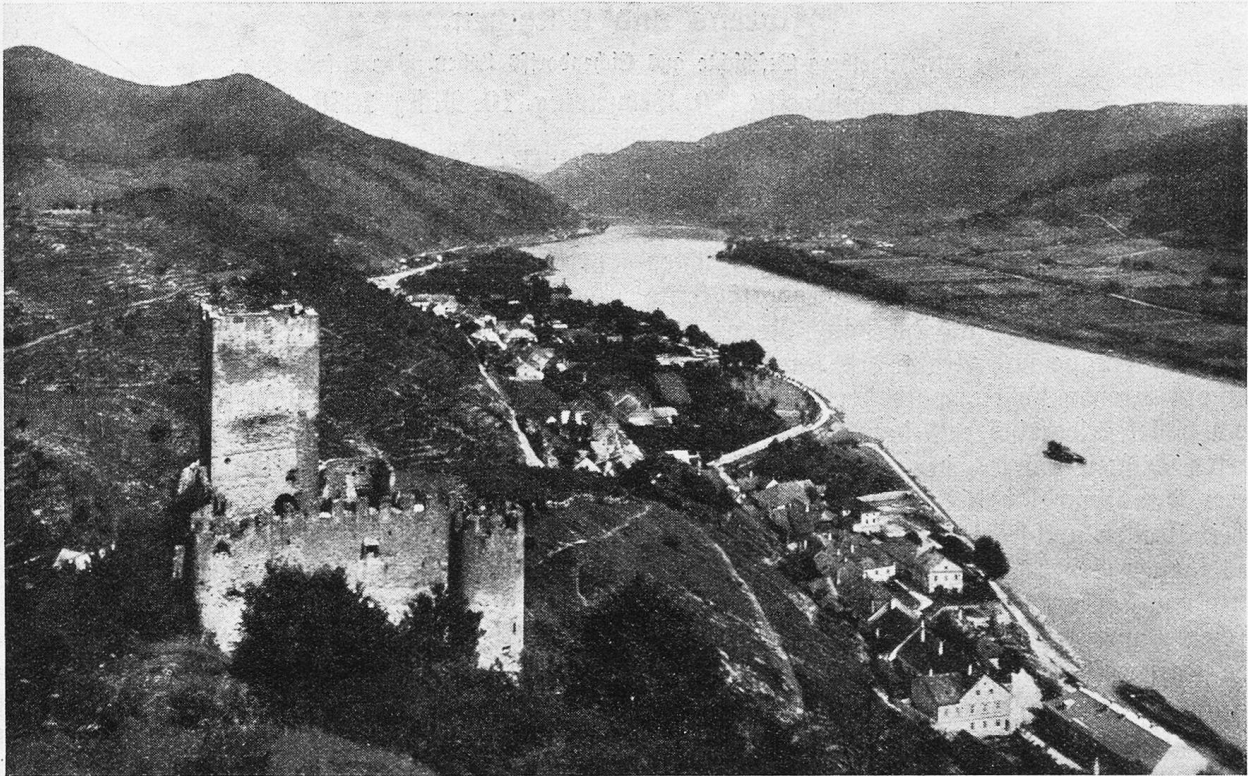
Ruine Hinterhaus mit Spis.

Miserere. Um so lauter hämmerte mein Herz vor banger Erwartung. Denn jetzt näherte sich der große Augenblick, bei dem all mein verhaltener Mut und meine aufgespeicherte Kraft sich vor der ganzen Gemeinde entfalten und im rechten Strahle blitzen sollte.