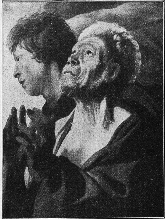
Jacob Jordaens: Zwei Studentenköpfe. Kunsthalle zu Hamburg.

Was die Streifereien durch die Stadt noch so kurzweilig macht, das sind die Rasperlspele. Unverhofft steht irgendwo ein Wagen, der zugleich Kulissenraum und Bühne ist. Ein recht-eckiges Feld steht wie ein Fenster geöffnet. In einem flinken Ruck nehmen die Figuren vorn an der Brüstung Platz, ein Bürger, ein Teufel und der Tod. Alsobald entspinnt sich ein lautes Scharmüzel, und gleich sitzen auch schon die ersten Hiebe. Das klatscht den armen Opfern um die Ohren! Hinterlist und Gewalt machen sich breit, und gute Volkswitze in echten und trägen Hamburger Wendungen würzen die unheilgeladenen Kontroversen. Der Spaß ist besonders auf die Kinder gemünzt. Sie umstehen denn auch in dichten Scharen das kleine Theater und beteiligen sich mit ihrem jugendlichen Temperament an den Kämpfen, die über ihren Köpfen ausgetragen werden. Zwischen den jungen Gästen und dem agierenden Lustigmacher hinter den Kulissen fliegen Zurufe hin und her, die nicht selten den Gang der Ereignisse bestimmen, und aus dieser stark improvisierenden Spielweise erhellt auch, daß es sich nicht um die Wiedergabe berühmter und textlich festgelegter Schwänke handelt, sondern um höchst willkürliche, aber oft doch fröhliche Stegreifstücke. Ein armes Mütterlein steht daneben und sammelt die Pfennige ein, die dem ge-