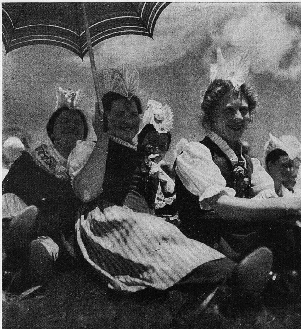
Stillvergnügte Schwyzerinnen machen ihre Sprüche.