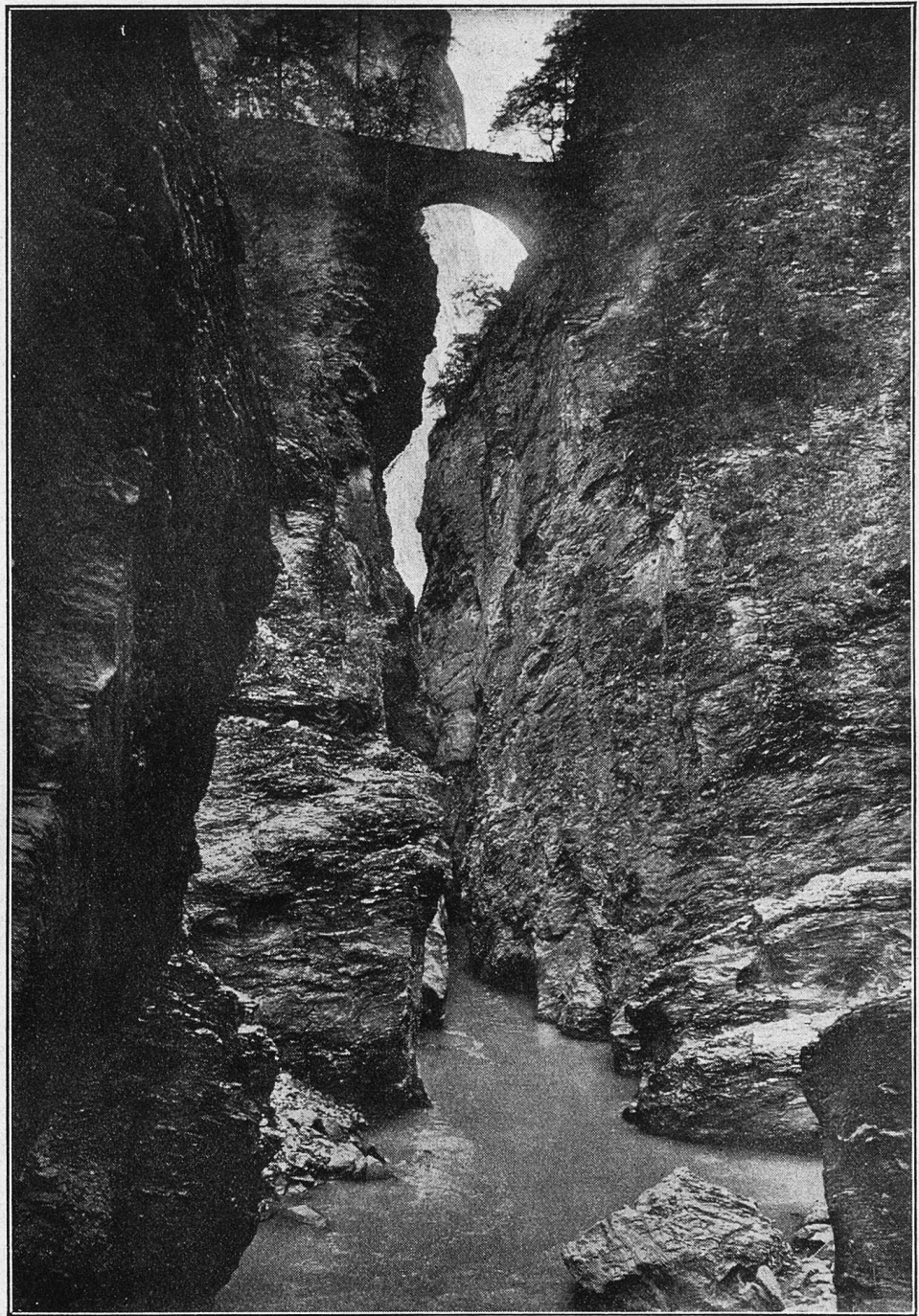
Viamala, zweite Brücke.

Tausendsassa im Handumdrehen: Er versetzte mich alsbald in einen wahren Rausch der Naturfreude und Wißbegier, als er mich mit heiligem Eifer von den Metamorphosen, Eigenheiten und Flugstätten unterrichtete, in ungezählten Schachteln und Kisten seine Raupenzucht vorführte, die Fanggeräte, Spannbretter, Fachbücher sowie die teuflischen Giftfläschchen anschleppte, wovor mich wahrlich ein gerechtes Staunen befiel. Welch eine Welt der Farbe, der Augenfreude, der wunder-