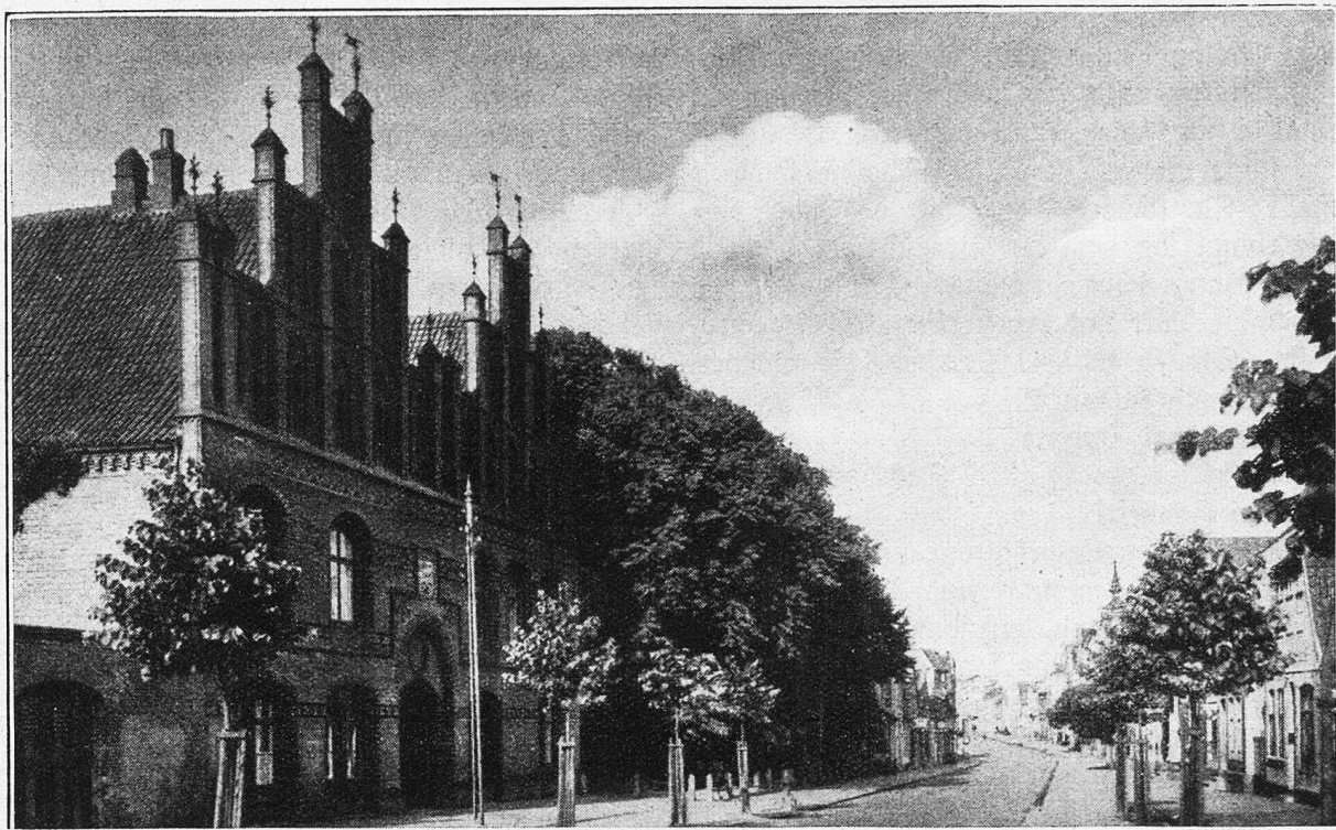
Husum: Osterende mit Kloster Sankt Jürgen.

was ich gern wüßte, ist dem Fremden meist eine Lust zu berichten. Jeder erzählt gerne von seiner Heimat, besonders, wenn er einen aufmerksamen und dankbaren Zuhörer findet. So flogen die Stunden herum, und ich bedaure oft, daß es schon längst Mitternacht geschlagen hat.