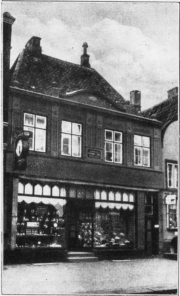
Husum: Geburtshaus Theodor Storms.

Nach dem ermüdenden Gang durch die Stadt, auf dem ich mir nichts entgehen lassen wollte, tat es wohl, eine Fahrt in die Umgebung zu unternehmen. Die Post brachte mich nach der dem Festland vorgelagerten Insel Nordstrand. Ein breiter, ganz neu eröffneter Damm führt hinüber und macht die Fremden bekannt mit den eigenartigen Verhältnissen, wie sie die Halligen bieten. Die eingedeichte Marschinsel, die über 40 Quadratkilometer umfaßt, ist dünn bevölkert. Die einzelnen Höfe liegen weit zerstreut. Es ist eine stille, einsame Welt. Viel Vieh weidet auf dem mageren Gelände. Kornfelder finden sich zwar auch. Da und dort steht eine große Windmühle, die ihre Flügel dreht. Ich habe die Insel durchkreuzt, bis ans andere Ende, wo man hinaus schaut ins Wattenmeer und nach den fernen, scheinbar auf dem Wasser schwimmenden Gehöften. Die Bauern führen dort sozusagen ein amphibisches Dasein. Zur Zeit der Ebbe sind sie streckenweise mit dem Festlande verbunden. Wenn aber die Wasser wieder kommen, werden sie in die Einsamkeit hinaus entrückt, und nur zu Schiff können die entlegenen Nachbarn besucht werden. Da gilt es, immer genau die Zeiten der fliehen-