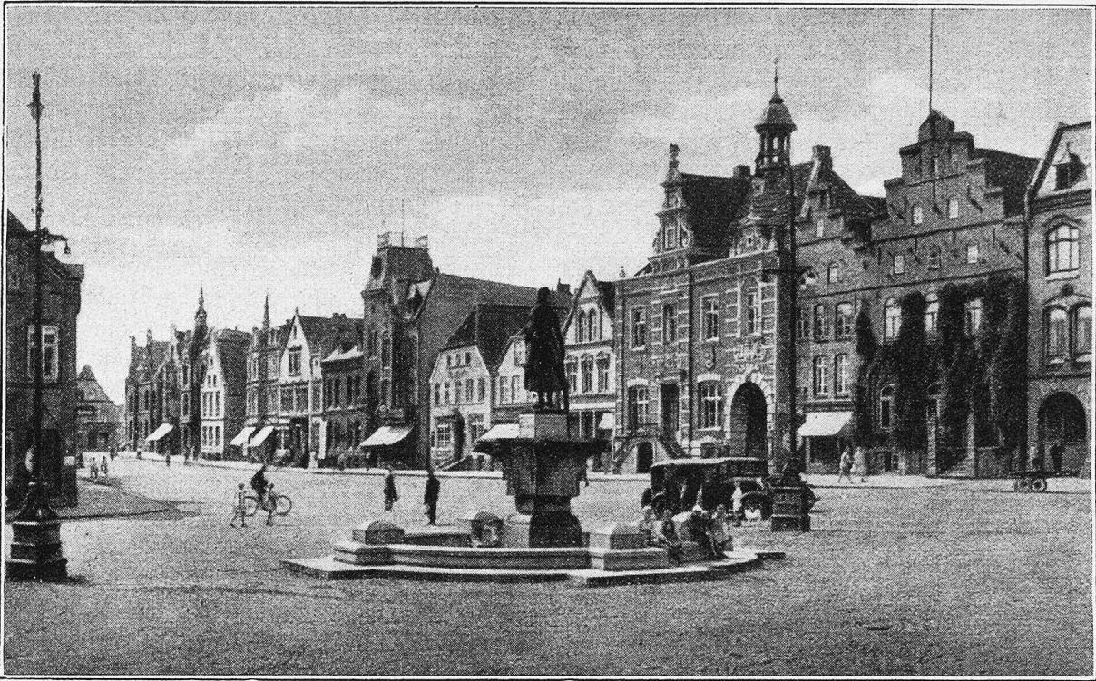
Hufum: Markt und Großstraße.

Nebel macht sich breit. Grau ist die Farbe, die vorherrscht, und ein Dunst liegt über den Dächern, der melancholisch machen könnte. So, wie's in Storms Liede lautet, habe ich Hufum auch gesehen. Freilich, zuletzt brach doch die Sonne durch und übergieß die alten Giebel mit einem festlichen Glanz.