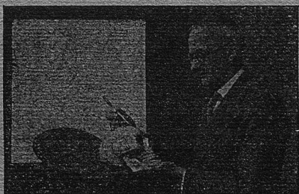
Spezialist im Ausarbeiten von Lebenshoroskopen

Sprechstunden: täglich von 13–16 Uhr oder vorherige telefon. Anmeldung: 51.154. Verlangen Sie Prospekte.