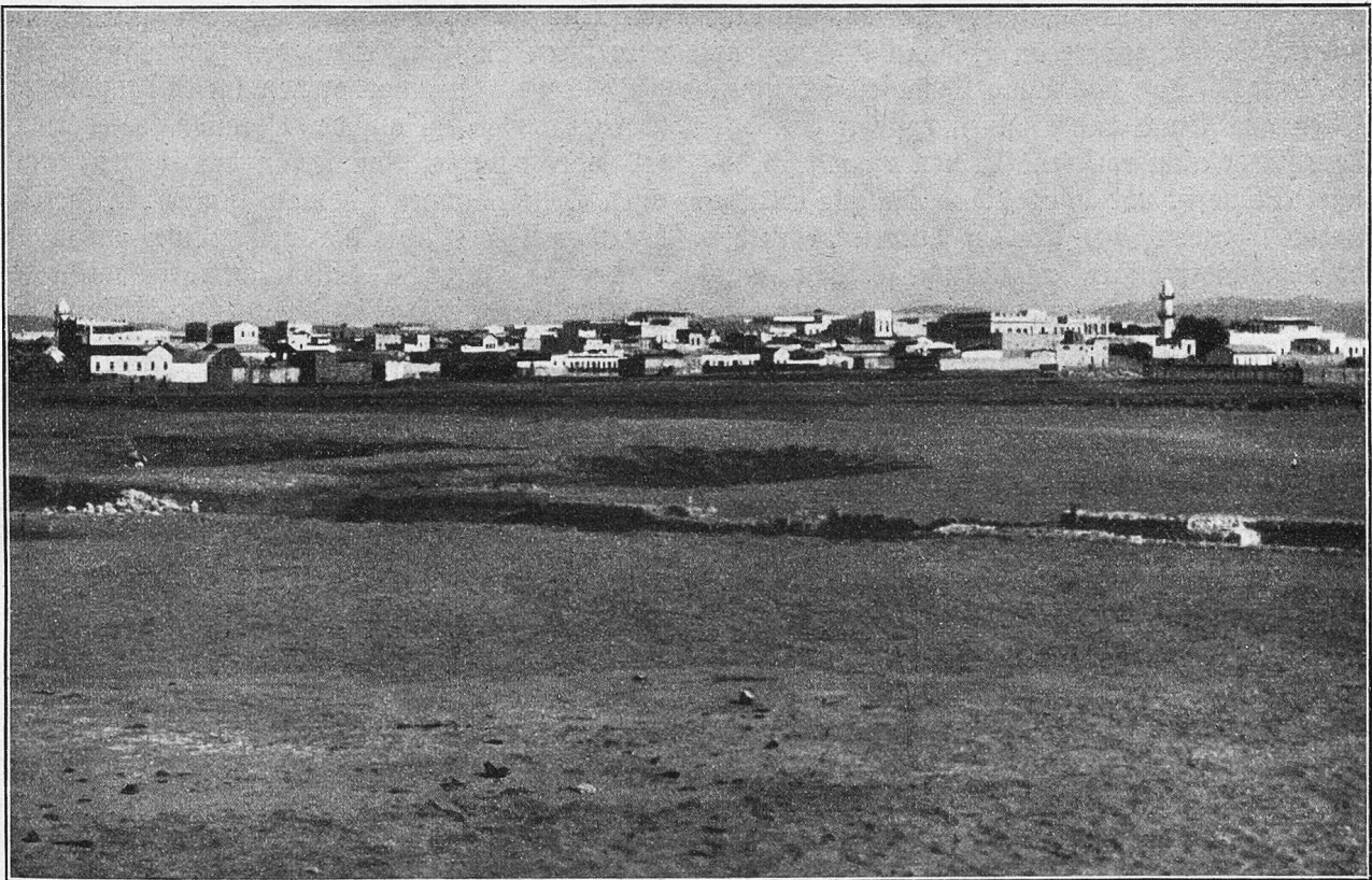
Die Stadt Djibouti in der Wüste.

gen Jahren rundeten die Kapitäne vorsichtig die klippenreiche Ecke. Und versuchte man die Passage durch Leuchtfeuer zu sichern, so zerstörten die Somaliniger immer wieder die Anlagen und ermordeten und vertrieben die Besatzung. Eine be-