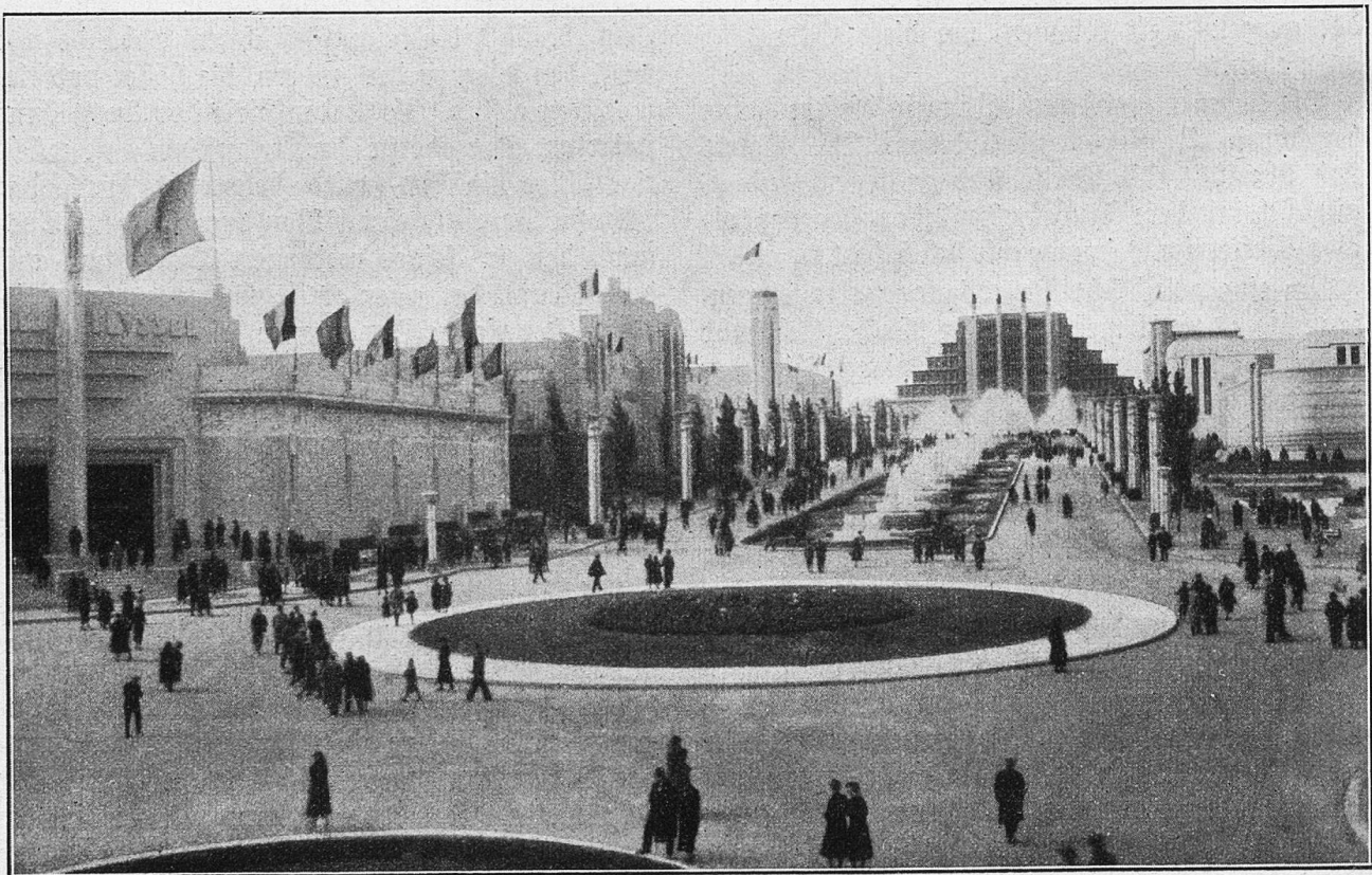
Weltausstellung in Brüssel: Blick nach dem großen Palast.

Halt, mich lockt jetzt das Gegenstück zu meiner Bergheimat. Ich mache den Niederlanden einen Besuch, und schon tummle ich mich im Lande der Windmühlen, der Blumenzwiebeln, der Kanäle und Schleusen, studiere die Schiffskurse nach den Kolonien und schaue zu, was für ein Nutzen aus den Plantagen gezogen wird. Auf großen Tabe-