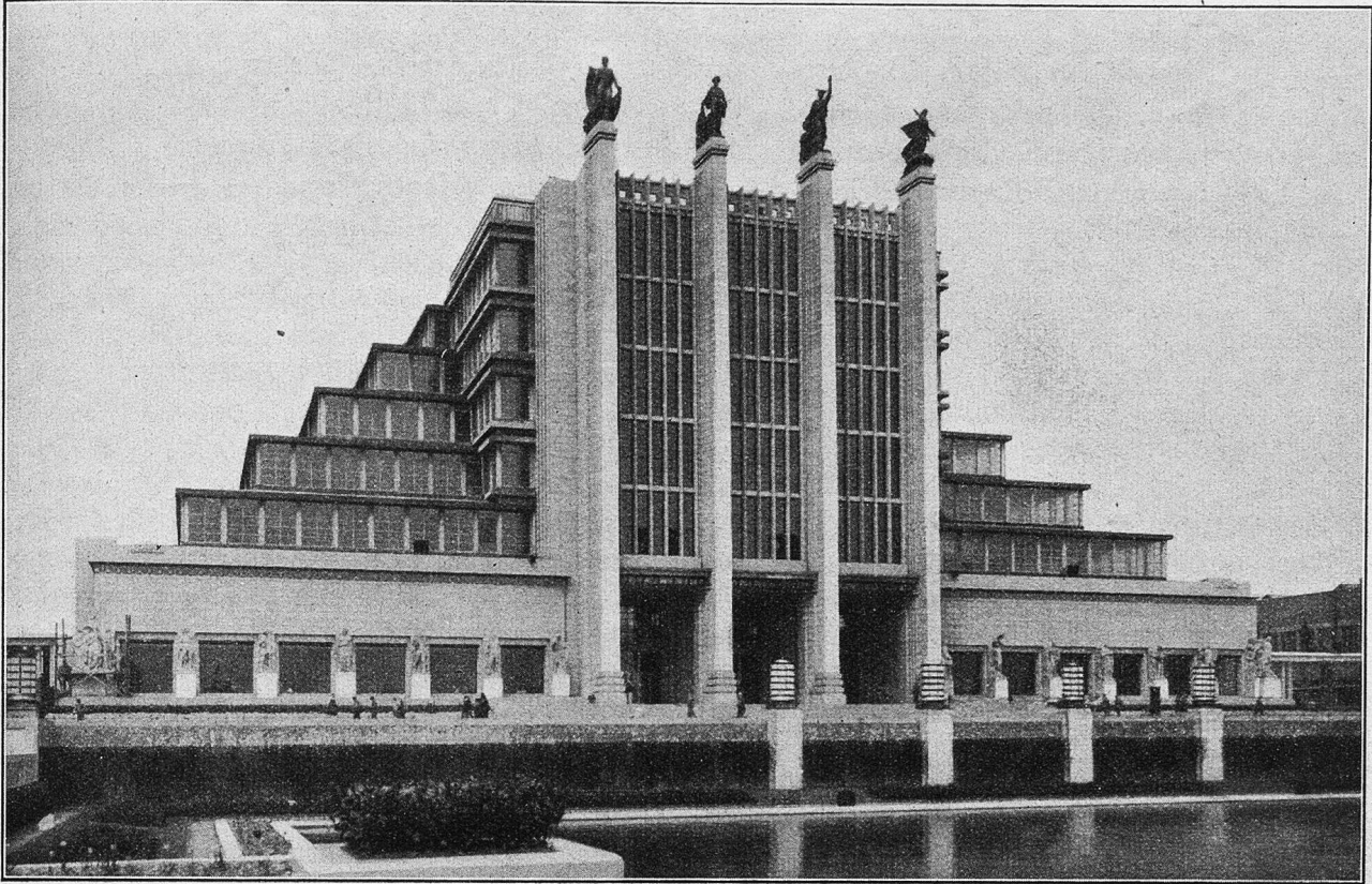
Weltausstellung in Brüssel: Der große Palast.

reichen Tag. Mählich entvölkerten sich die Straßen und Gassen. Die Gäste strömten nach Hause. Die Lichter wurden ausgedreht. Auch die Ausstellung bereitete sich einen guten Schlaf. Sie verfolgte mich in die Stadt hinein. Widersprüche beschäftigten mich, und sie wollten nicht weichen. Das blendende Bild der Länderschau täuschte eine Blüte industrieller und internationaler Erfolge vor. Friedlich hatte sich Land neben Land, Erdteil neben Erdteil gestellt, und der Run um das Schaffen der verschiedenen Nationen hat erstaunliche und erhebende Früchte getragen. Es herrscht ein bewegter Verkehr von Haus zu Haus, von einem Raum der Aussteller in den andern. Und man ist versucht zu glauben, daß der gute Wille ringsum besteht, diese Werke ruhiger Entwicklung zu fördern, daß sie zum Nutzen aller werden. — Doch, ins Hotel zurückgekommen, braucht man nur eine Zeitung aufzuschlagen, und die schönen Gedanken stürzen wie ein Kartenhaus zusammen. Ringsum lauert ein Mißtrauen. Jedes Land beargwöhnt und fürchtet seinen Nachbar, von Einverständnis und Pakten ist die Rede,