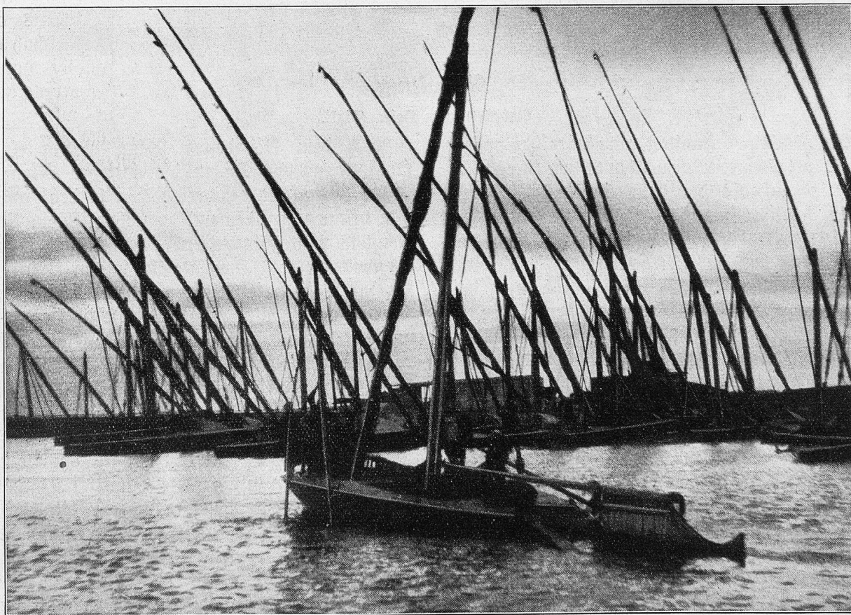
Im alten Hafen von Port Said am Menzalesee.

Hoffmann zog eine Grimasse. „Ein hurtiger Herr. Er weiß mich Mozart-Freund und dreht den Spieß um.“ Er hatte Weber gegenüber Platz genommen und bestellte sich eine Bouteille Burgunder. Über sein schnell bewegliches Gesicht glitt bald schmunzelnde Zufriedenheit. Weber machte einen vortrefflichen Eindruck auf ihn. Dann sprach er von seiner verunglückten Oper. „O, mein Undinchen! In Liebe gezeugt, in Hoffnung gereift! Und so grausam in Flammen mußt du sterben!“ Weber auf einmal starr anblickend: „Wahrhaft, ihr Untergang wird Euer Aufgang