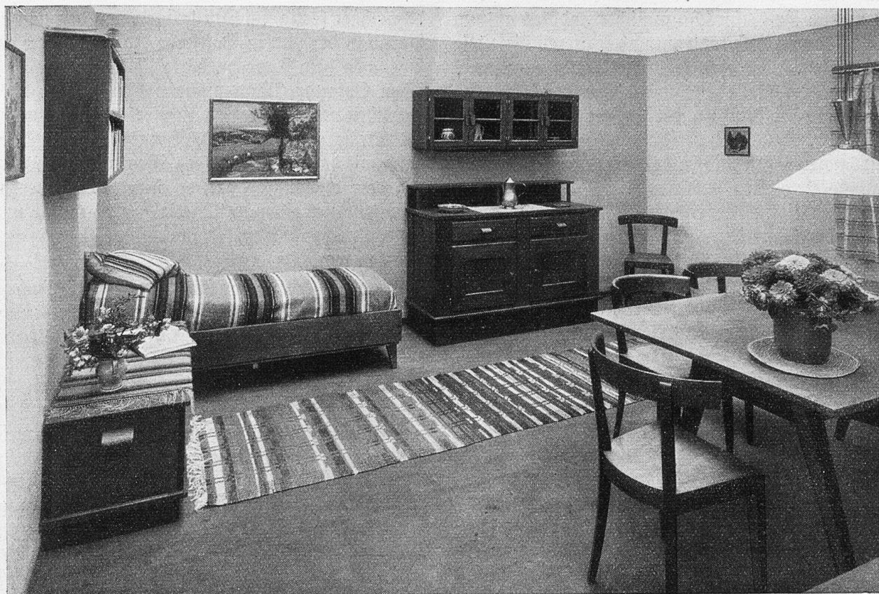
Wohnraum mit handgewobenen Stoffen (Schweizer Heimatwerk).

Spiel ein möglichst freundliches Gesicht zu machen. Ja, man redet den Guldnerinnen nach, sie wüßten auch den Alten Sand in die Augen zu streuen; manche, die fast wie eine Magd auf einen Hof gekommen, habe schon nach kurzen Wochen als Bäuerin das Regiment fest in der Hand gehabt.