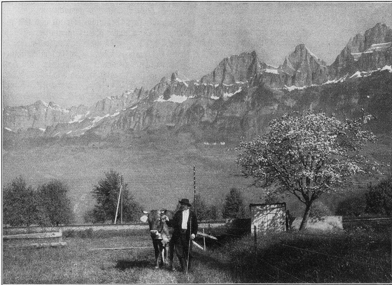
Kurfirsten bei Wallenstadt.