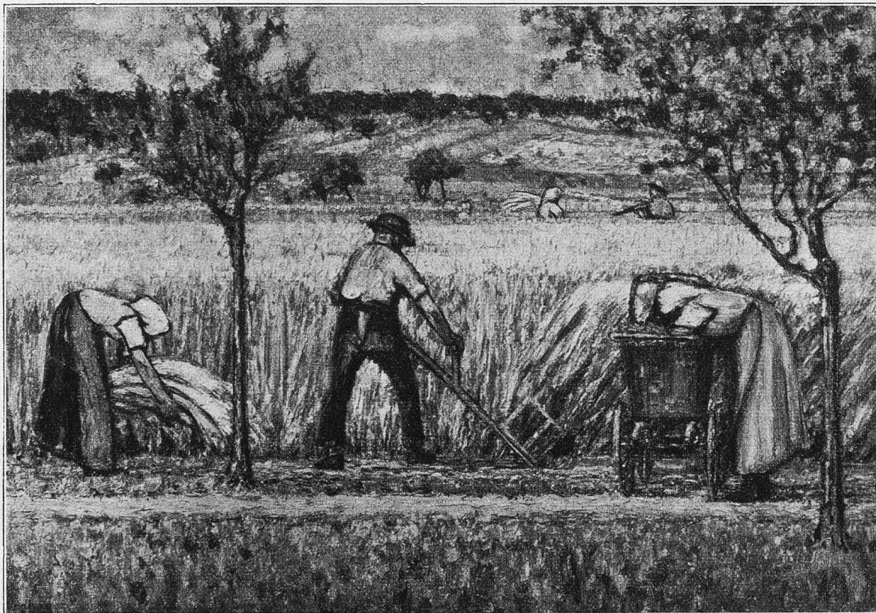
Ernte. Nach einem Gemälde von Jean Affeltranger.

eingesessene, in vielen Fällen leider gerechtfertigte Mißtrauen des Volkes gegenüber allem Künstlertum, daß des Künstlers Mutter auf den freudigen Bericht des ersten großen Bildverkaufs im Münchner Glaspalast nur die lakonische Antwort fand: „Du verdienst dini Sachringer als mir!“ Wer hörte da nicht auch zugleich das Urteil des alten Lößemer Gemeindevorstandes Heer über seinen Sohn, den „Fabelschreiber“!