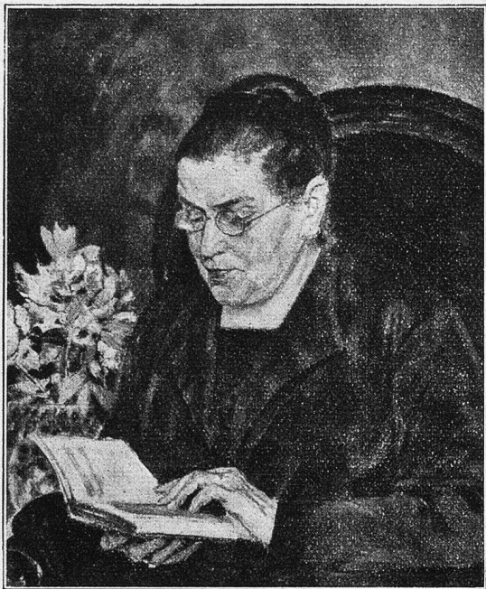
Jean Affeltranger: Damenportrait.

das Leben als Geschenk und das Werk als dieses Lebens Wesentlichstes zu betrachten, sie verbieten ihm, viel aus sich selbst zu machen. Der Lebensernst, ihm und seinem Werke eigen, vermählt sich