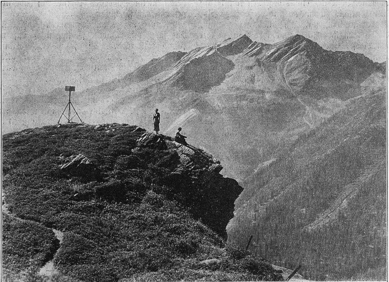
Auf sonniger Höhe bei San Bernardino.