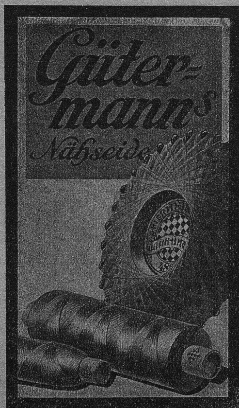
Gütermanns Nähseiden A.-G. Zürich Fabrikation in Buochs (Nidwalden)

Die Schweiz. Lehrerzeitung schreibt: „Es ist nicht auszu- denken, welchen Segen der Pestalozzi-Kalender ver- breitet; — er ist ein Miterzieher erster Güte.“