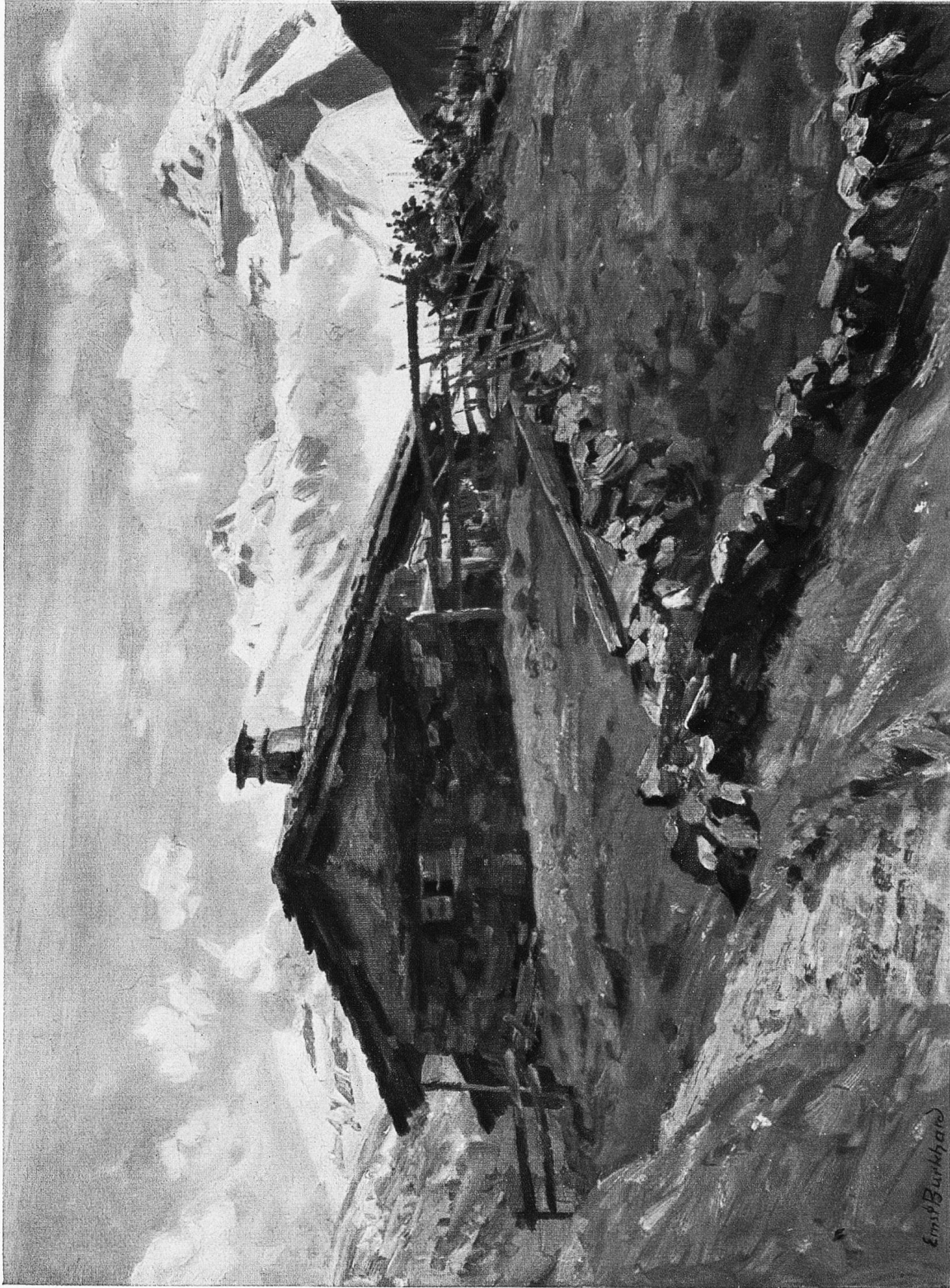
Alphütte bei Braunwald. Nach einem Gemälde von Emil Burkhard, Nidterswil