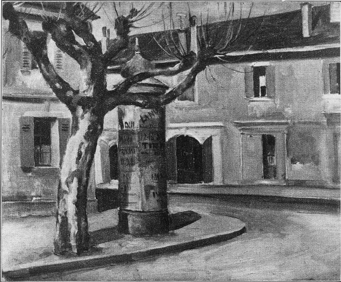
Ein Winkel in Carouge bei Genf.