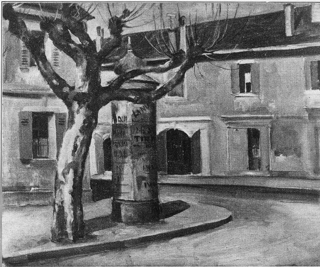
Ein Winkel in Carouge bei Genf.