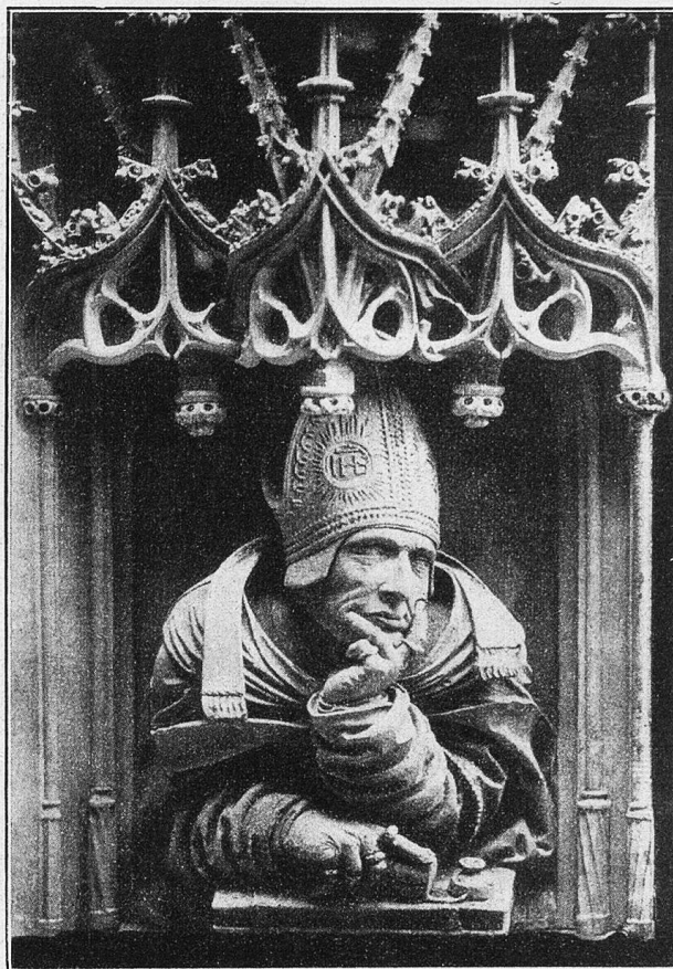
Wien. St. Stephan. Kanzel, Büste eines Kirchenlehrers.

Derlei Altäre, Baldachine, Epitaphe, Kapellen, Emporen, Grabmale, Statuen, Gestühle, Galerien wären noch viele aufzuzählen. Noch wäre von den Toren zu sprechen, vom Singerstor, vom Bischofstor, die in die Kirche führen, vom Adlerturm, der um 1511 abgebrochen wurde, vom Zahnwehhergott, von den Wasserspeiern, von der Capistran-Kanzel, vom goldenen Adler an der Spitze des Turmes, von den Tafelinschriften, die sich vorne an der Hauptfront des Domes finden; und vor allem von der gewaltigen Pummerin, einer Glocke, die nicht weniger als 19,800 Kilogramm wiegt und um 1711 von Johann Hamer aus dem Metall eroberten türkischer Kanonen gegossen wurde: ja, von all dem könnte noch mancherlei gesprochen und erzählt werden: der Raum erlaubt es nicht. Und manch eine Sage und Legende knüpft sich an den Dom und an die Baugeschichte dieses Domes. So gehe jeder, den der Weg nach Wien