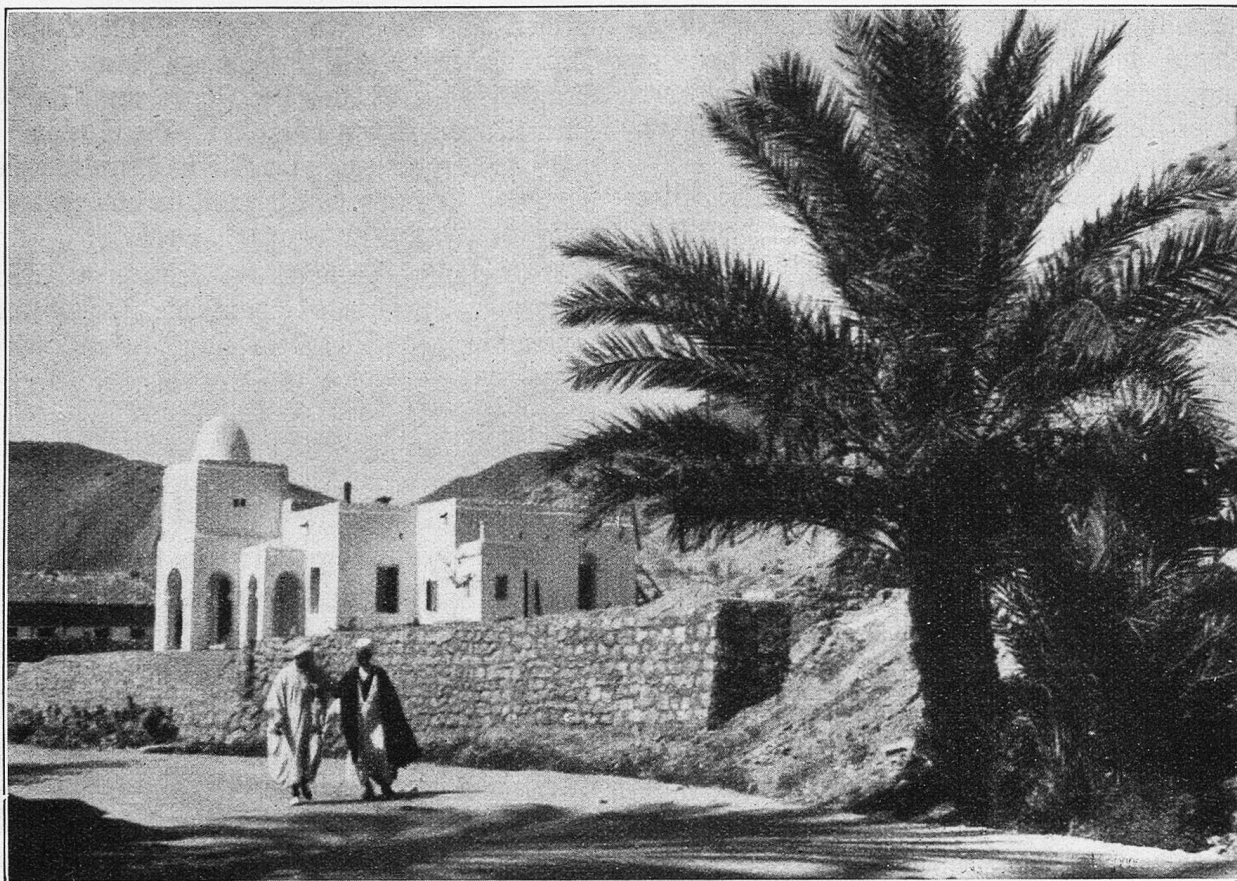
El Kantara. An der Hauptstraße.