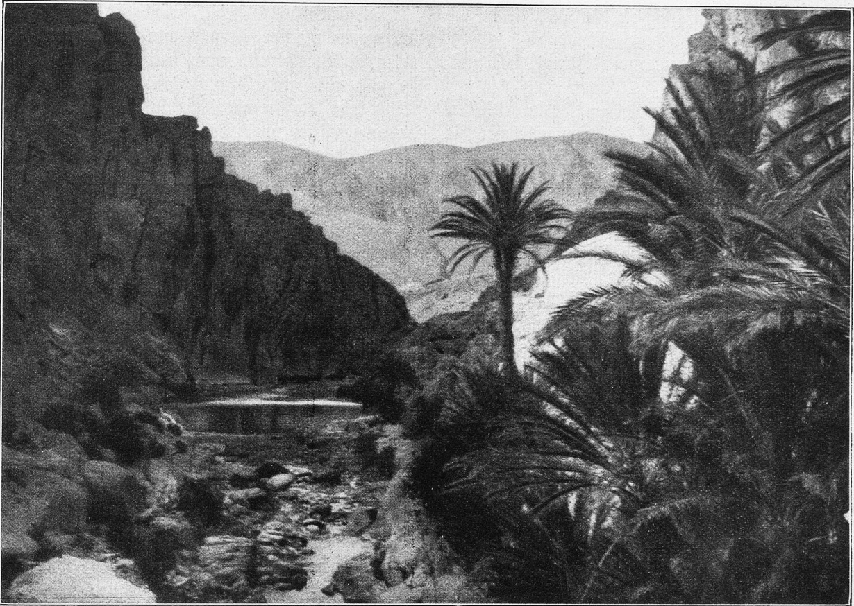
El Rantara. Palmen am Flusse.