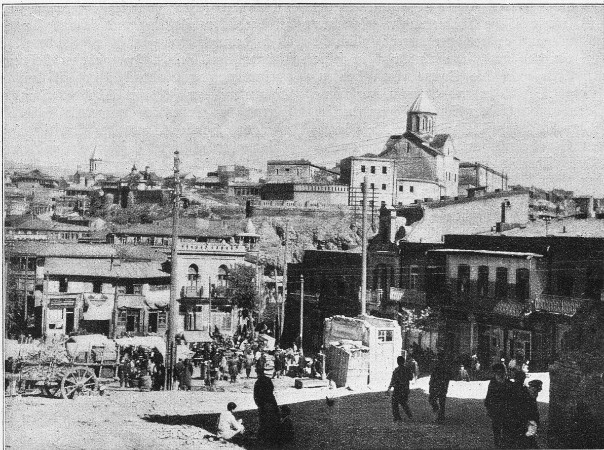
Tiflis, im Bazarviertel.