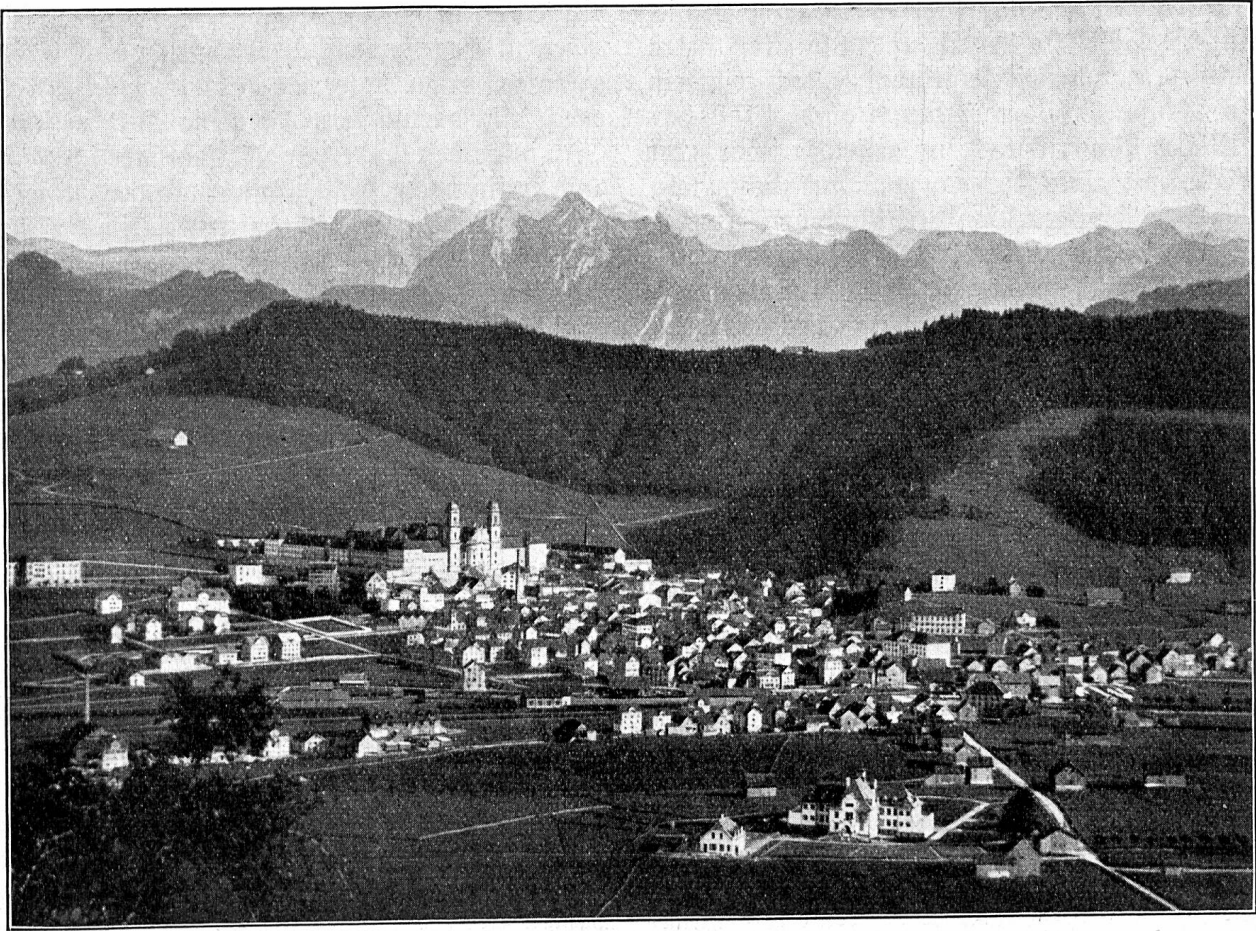
Einsiedeln mit Glärnisch und Fluhbrig.