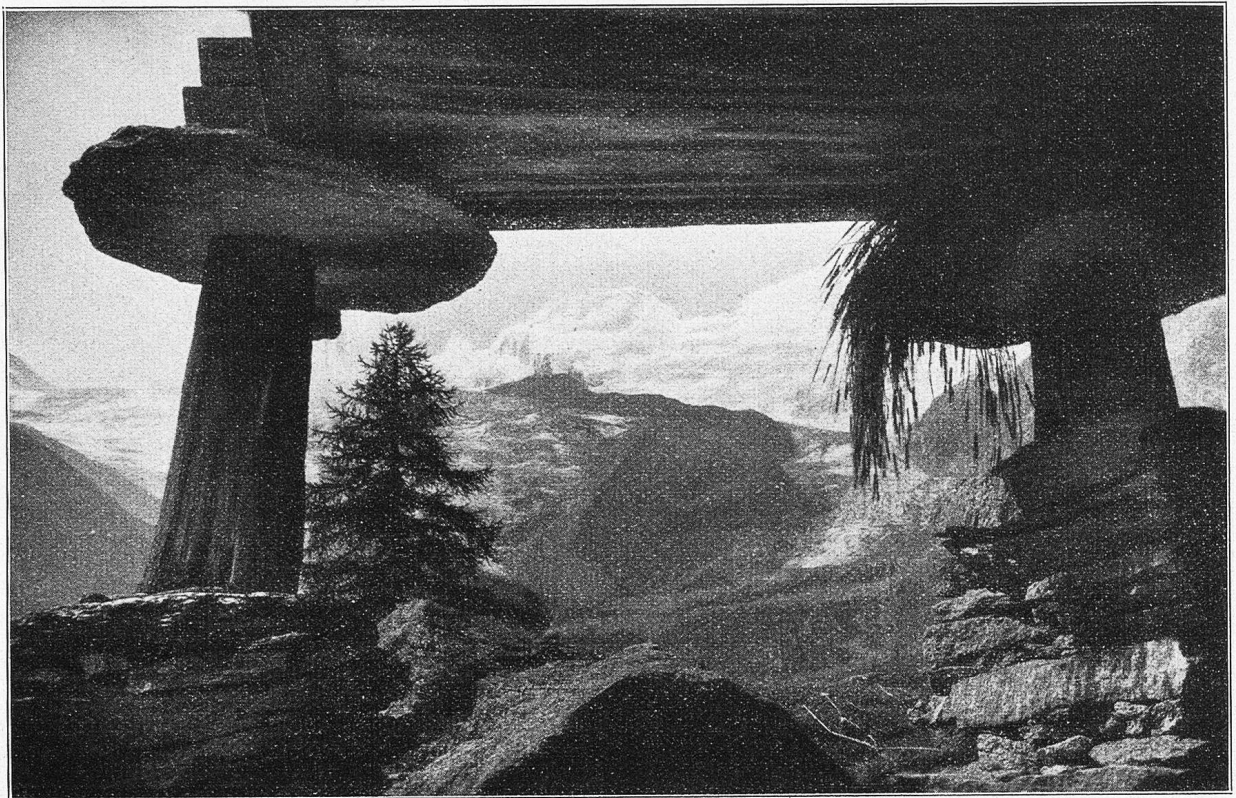
Stadel in Saas-Fee.