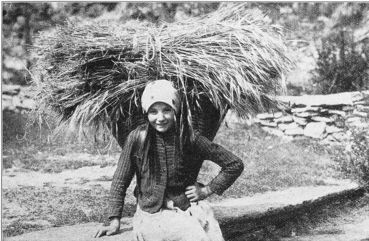
Mädchen aus Saas-Fee, am Werktag.