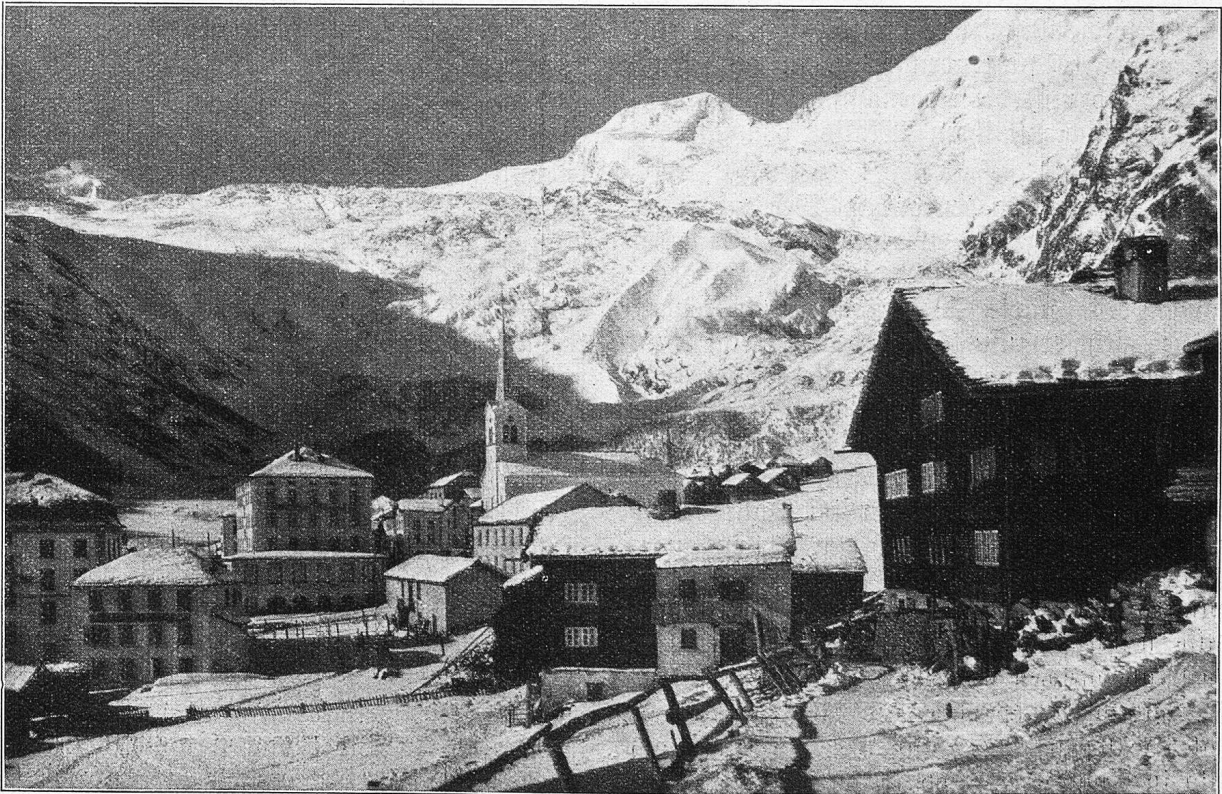
Saas-Fee im Winter. Malinhorn und Alphubel, Feggletscher. !!