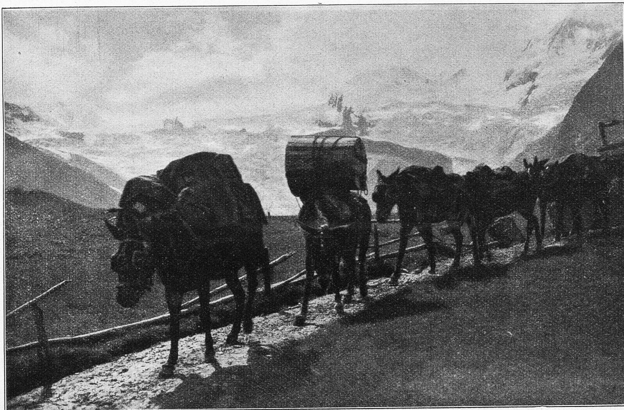
Maultierpost nach Saas-Fee.