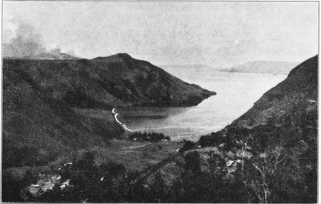
Bild 1: Saranggaul am Tobameer, Battakland. Der größte Binnensee auf Sumatra.