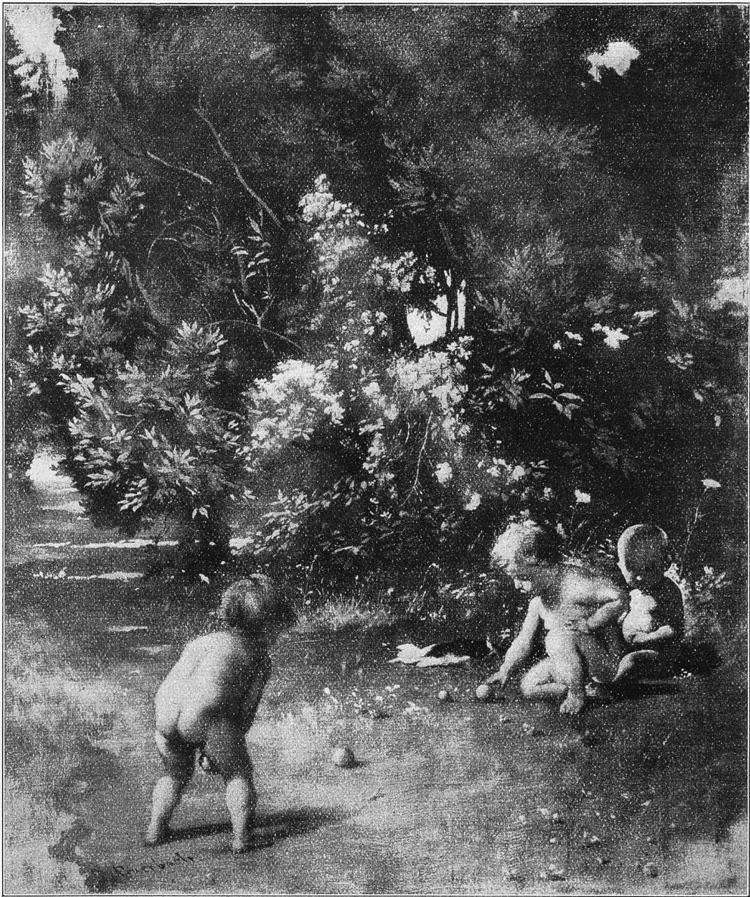
Feuerbach: Boccia spielende Kinder.

Gerda rührte sich nicht. Mit Schindler in die Berge klettern? So willkommen ihr die Gelegenheit gewesen wäre, der Gedanke paßte ihr nur halb. Was würde Sigmund Vonbühl dazu sagen? Und doch, sie empfand einen brennenden Wunsch, einmal auf die kühne Spitze des Piz Rifella zu steigen. Die Tour war nicht zu schwierig, hatte sie sich schon erklären lassen. Und kurzweilig und abwechslungsreich war sie. Es ging über eine wilde Geröllhalde, über ein prächtiges Schneefeld und einen ungefährlichen, steilen Gang empor, über den man beim Abstieg eine lustige Rutschpartie machen könnte.