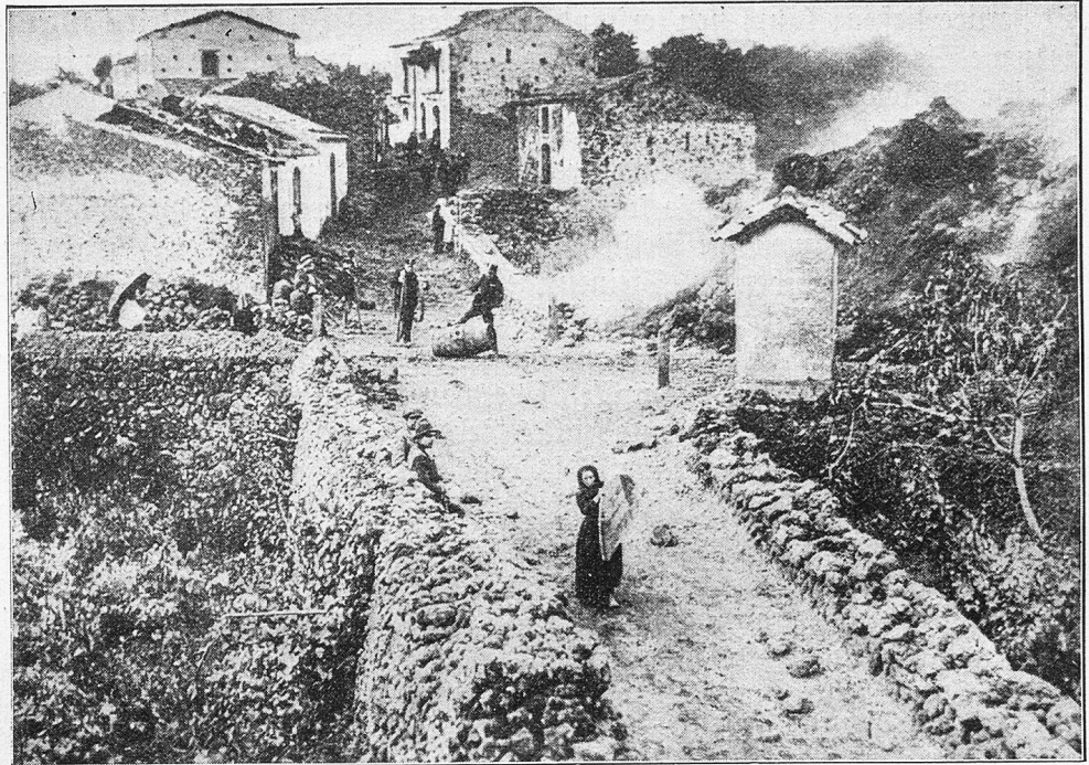
Die Feuerwalze des Aetna, die mehrere Ortschaften dem sichern Untergange weihte.

Die Geschichte des Aetna kennt gegen hundert größere Ausbrüche in historischer Zeit. Diodor erwähnt sogar einen fünfhundert Jahre vor dem trojanischen Krieg. Der erste historische fand 693 Jahre vor Christi Geburt statt. Daran knüpft sich eine schöne Sage: Zwei, ihre greisen Eltern auf den Schultern forttragenden Brüdern wich der sonst alles überflutende Lavaström aus. Ähnliches hört man an verschiedenen Orten auch aus christlicher Zeit, nur mit dem Unterschied, daß das wilde Element nicht mehr vor gewöhnlichen braven Menschenkindern, wohl aber vor der Madonna, Heiligenbildern und Kapellen Halt machte. Die Ungläubigen, deren es auch auf Sizilien gibt, behaupten allerdings, die abwehrenden Bilder der Schutzgeister seien erst hingekommen, nachdem die Lava von sich aus stehen geblieben, oder sie seien an Orten aufgestellt worden, wo der glühende Strom nach geologischen Berechnungen stehen bleiben mußte. Es bleibt natürlich jeder-